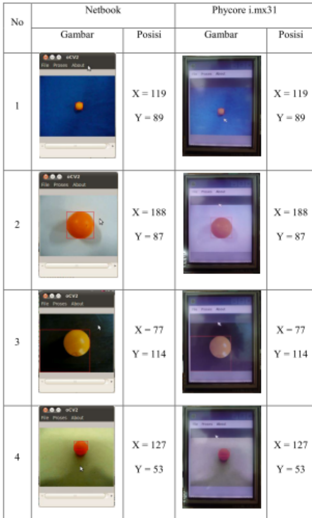
Tabel 1. Perbandingan Hasil Pendeteksian Bola Menggunakan Metode Integral Proyeksi pada Phycore i.mx 31 dan Netbook Intel Atom.