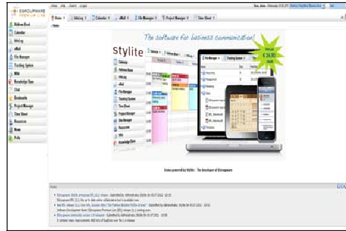
Gambar 3. eGroupware

menyediakan fasilitas penyimpanan email di sisi server dan memperkenalkan mail client berbasis ajax yang dinamakan WebAccess . [10]