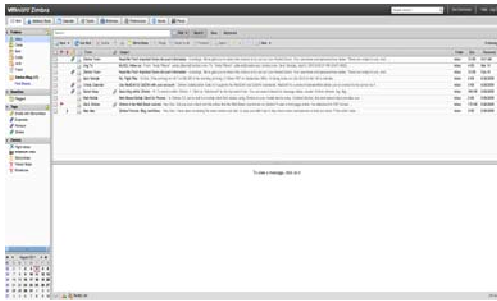
Gambar 1. Zimbra

Feng Office merupakan SaaS (Software as a Service) yaitu model pengembangan software bisnis yang memberikan layanan kepada customer dengan mengintegrasikan layanan dukungan, perbaikan dan infrastruktur server. Aplikasi ini menyediakan solusi terintegrasi tanpa mengkhawatirkan lisensi software dan server berbayar. Layanan yang diberikan berupa konfigurasi software, pemeliharaan, update otomatis, informasi cadangan, dan membantu client dengan ketidaknyamanan yang ditemukan ketika mengintegrasikan dengan software lain [9] dokumen, instant messaging, serta manajemen kontrol dengan teknologi AJAX terbaru. [11]