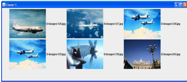
Gambar 8 : Contoh Hasil Klustering

Pada percobaan ini, gambar kluster 1 didominasi dengan gambar warna biru langit dan didominasi bentuk pesawat, dengan tingkat kemiripan 0.91 .