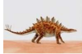
Gambar 11: Contoh Gambar Query