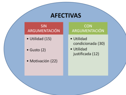
Figura 3. Categorías afectivas con tendencia positiva

categorías establecidas, podemos concluir que cinco de ellas reflejan una actitud en sentido positivo hacia el uso de dicho recurso material para hacer y aprender matemáticas, como puede verse en la Figura 3.