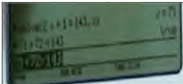
Figura 5. Sintaxis de la ecuación en la calculadora

El único grupo que encontró la ecuación comunicó sus resultados así: “ lo que hicimos mi equipo y yo, fue poner solve, usamos el factor solve le pusimos x porque no encontramos el valor de la suma, y al otro valor consecutivo le pusimos x más. Y le pusimos igual a 143, para encontrar el número en el paréntesis le pusimos la coma y la x. Y ya le dimos enter y nos salió el resultado, entonces abajo hicimos la comprobación...y nos salió True (Figura 5). Y nos guiamos de esto para hacer lo de lápiz y papel ”.