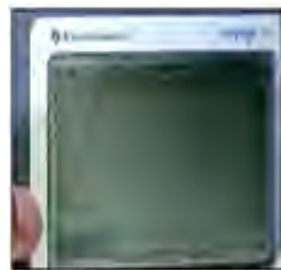
Figura 4. Al tanteo

El único grupo que encontró la ecuación comunicó sus resultados así: “ lo que hicimos mi equipo y yo, fue poner solve, usamos el factor solve le pusimos x porque no encontramos el valor de la suma, y al otro valor consecutivo le pusimos x más. Y le pusimos igual a 143, para encontrar el número en el paréntesis le pusimos la coma y la x. Y ya le dimos enter y nos salió el resultado, entonces abajo hicimos la comprobación...y nos salió True (Figura 5). Y nos guiamos de esto para hacer lo de lápiz y papel ”.