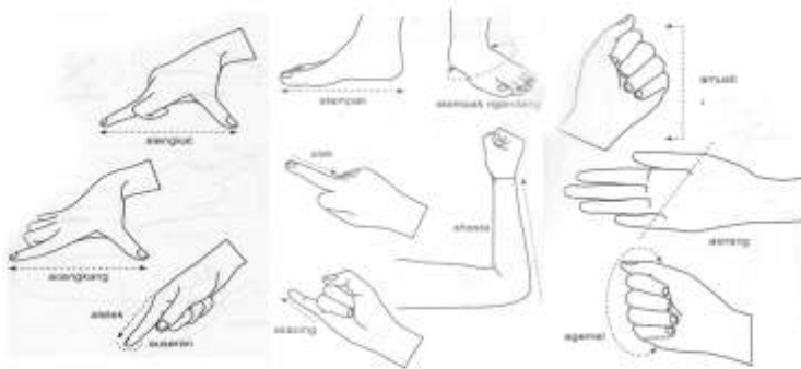
Gambar 3. Sikut yang didasarkan pada ruas tangan dan kaki

Konteks ukuran dan bentuk Bangunan Tradisional Bali mengacu pada Skala bagian – bagian tubuh manusia seperti ; lengan, tangan, jari , kaki dan telapak kaki. Jika yang dibangun rumah tinggal, maka yang menjadi skala pokok ukuran adalah si pemilik rumah atau kepala keluarga. Sedangkan untuk tempat suci ( Pura, Merjan dan lainnya ) mengacu pada ukuran pengemong tempat suci tersebut. Ukuran bentangan tangan ( depa agung, depa madya dan depa alit ) dipakai untuk mengukur panjang dan lebar pekarangan, tapak kaki dipakai untuk mengukur jarak anatra komponen bangunan dengan bangunan lain yang ada di halaman peumahan atau natah umah, dan jarak masa bangunan ke tembok – tembok pekarangan sekelilingnya. Sedangkan untuk tinggi bangunan dan atau dimensi bangunan sipakai satuan ukuran, dari bagian-bagian tangan, ruas-ruas jari, tebal jari yang masing-masing disebut dengan Aguli, agemel, acenggang dan amusti. Sebagai satuan ukuran bangunan tradisional Bali adalah Rai ( 1 rai = +_ 10cm )