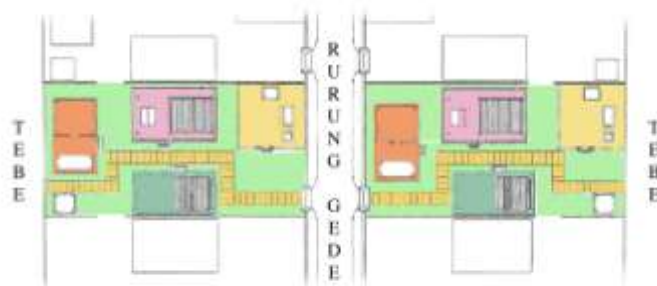
Gambar 7. Tata letak dan Orientasi Pemukiman Rumah Adat yang berhadap-hadapan di desa adat Penglipuran