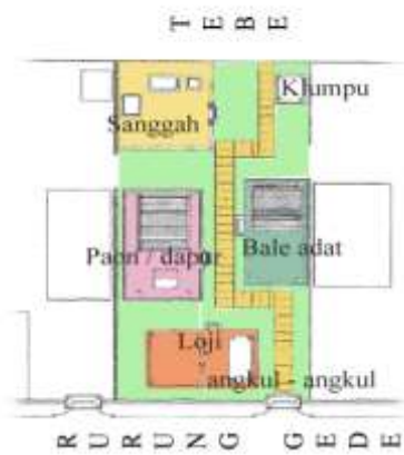
Gambar 6. Lay out Rumah Adat penglipuran