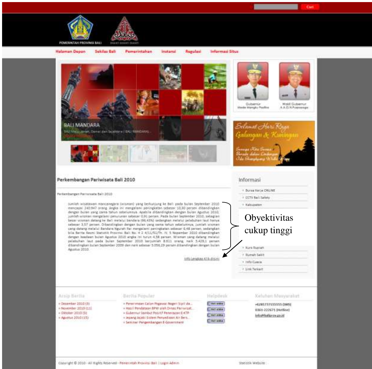
Gambar 7. Salah satu halaman “Statistik” pada situs resmi pemerintah propinsi Bali

Pada gambar 7 diatas dapat dilihat bahwa tingkat obyektivitas dari situs tersebut sangat tinggi dimana dalam informasinya dicantumkan, tanggal informasi lengkap dengan surat keputusan yang dapat diunduh secara langsung pada “Info Lengkap Klik disini”. Semua itu merupakan bentuk-bentuk obyektivitas yang ditunjukkan oleh situs resmi pemerintah propinsi Bali.