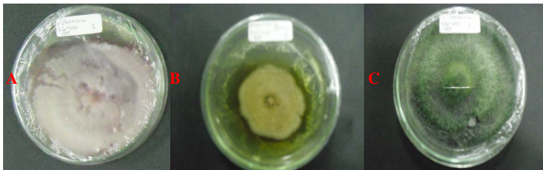
Gambar 3. Kultur Jamur a) Fusarium b) Penicillium c) Trichoderma pada media pupuk kompos daun oleh dari perlakuan ampas kedelai, dedak dan serbuk gergaji .

yang mengandung filtrat kompos daun atau pupuk kandang bersifat kompatibel terhadap pertumbuhan jamur Trichoderma sp. , Penicillium sp. dan Fusarium sebagaimana tampak pada Gambar 2 dan 3. Kompatibilitas media yang berasal dari bahan organik tanaman pernah juga didapatkan pada hasil penelitian Warsini (2005) yang menunjukkan bahwa