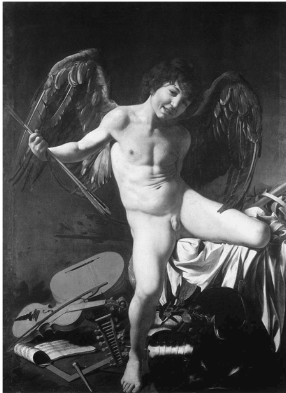
Abbildung 5 Michelangelo da Caravaggio: Amor vincitore , Öl auf Leinwand, 1601/1602, Berlin, Staatliche Museen, Gemäldegalerie.

Reni scheint freilich noch weiter gegangen zu sein: Er identifizierte sich richtiggehend mit dem Thema Putten und speziell dem himmlischen Amor, der sich zudem fast nahtlos in das Ideenfeld der christlich-göttlichen Liebe überführen ließ. Nicht zufällig dürfte der Maler etwa 1627 als Probestück einen schlafenden Putto gemalt haben (Abb. 1), dessen Typus er auch bei mehreren Christuskind-Darstellungen verwendete. Und Reni hatte auch schon einen seiner bis dato größten künstlerischen Triumphe 1611 mit der Strage degli Innocenti , der Ermordung der unschuldigen Kindlein, denen die Engelsputten bereits die Märtyrerpalmen aus dem Himmel reichen, gefeiert. 2 Der dramatisch zum Schrei geöffnete Mund des mittleren Amors auf der Lotta dei Putti könnte sogar direkt auf die entsprechenden, berühmten Affektfiguren des früheren Gemäldes anspielen. 1640 sollte dann Giovanni Andrea Podestà Reni einen allegorischen Kupferstich dedizieren, in dem unter anderem dessen Vermögen, verschiedene Formen der Liebe auf der Leinwand darzustellen und letztlich visuell in einen liebenden Aufstieg zum Geistigen (und zu Gott) hin zu transformieren, thematisiert ist (Abb. 6). 3 Und wiederum blieb