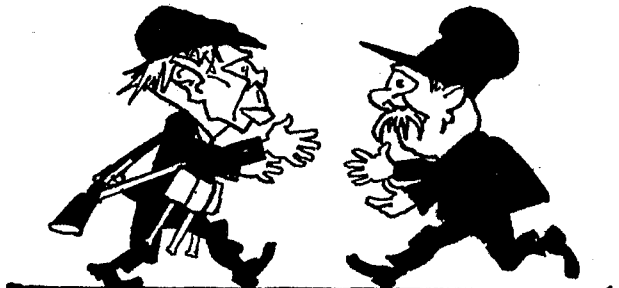
Den Rest der Mehrheitssozialisten Verföhlingen bald die Spartakisten.