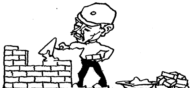
Den Aufbau, nicht die Lodderei, Das will die Deutsche Volkspartei.