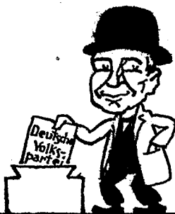
Und willst du's auch, greif' nicht daneben, Lass' die den richt'gen Zettel geben. Dann kehet auch Ordnung und Verstand Zurück ins deutsche Vaterland.