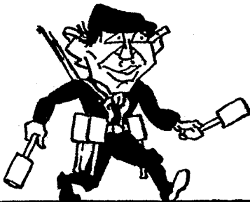
Wer für die Handgranaten ist, Bekenne sich als Kommunist.