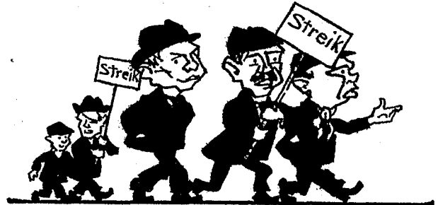
Für „Unabhängig“ stimmt der Mann, Der ohne Streik nicht leben kann.