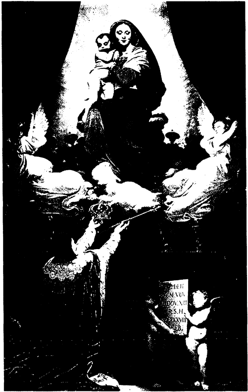
Jean-Auguste-Dominique Ingres, Das Gelübde Ludwigs XIII., 1824, Montauban, Kathedrale

Die französische Nationalgeschichte liefere diejenigen Stoffe, die den Modernisten zu interessieren haben, und seien es auch Episoden aus vergangenen Epochen. Diese nämlich haben gegenüber den altehrwürdigen Geschichten aus der Antike den Vorteil, in einem Entstehungszusammenhang mit der Gegenwart zu stehen, 38 während das Antike selbst nur noch in seinem radikalen Vergangenheitscharakter begriffen und genossen werden könne. In der positiven Rezension zu einem Werk zur französischen Geschichte 39 unterstreicht Jal die Unsinnigkeit des Antikismus, der seiner Meinung nach noch immer die Schulausbildung seines Landes präge und immer nur das Negative in der eigenen Geschichte hervorhebe. "Mais des belles actions de nos preux, des nobles résistances à l'oppression, des progrès de la civilisation et de la science, pas de nouvelles!" Alles wisse man über die Antike, aber für die Probleme der Gegenwart gäbe es keine Vorbereitung. "On commence cependant à reconnaître tout ce que ce système avait d'absurde; on sent qu'il est bon d'être de son pays et de son temps." Nationalgeschichte ist damit auch immer Befreiungsgeschichte ("les nobles résistances à l'oppression"). Spätestens hier wird klar, warum Jal gerade diejenigen Bildthemen bei Géricault und Delacroix schätzt, die einen aktuellen Bezug aufweisen und das Schicksal unterdrückter Personen oder Völker beschreiben; warum er andererseits mit solchen exotischen Stoffen wie dem Tod des Sardanapal weniger anfangen kann.