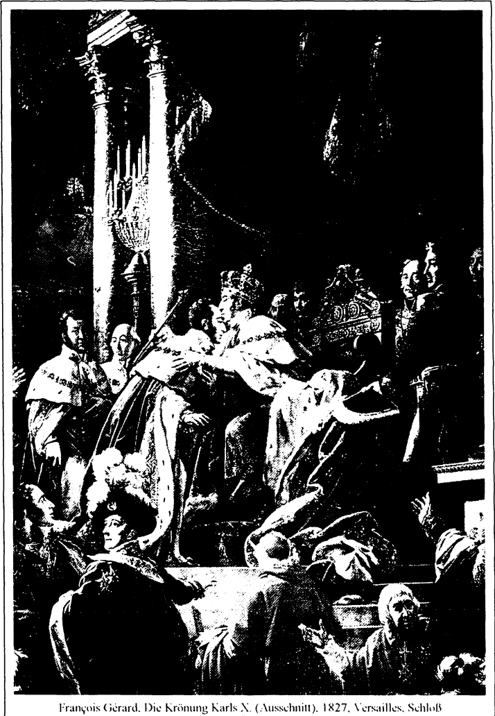
François Gérard. Die Krönung Karls X. (Ausschnitt), 1827, Versailles, Schloß