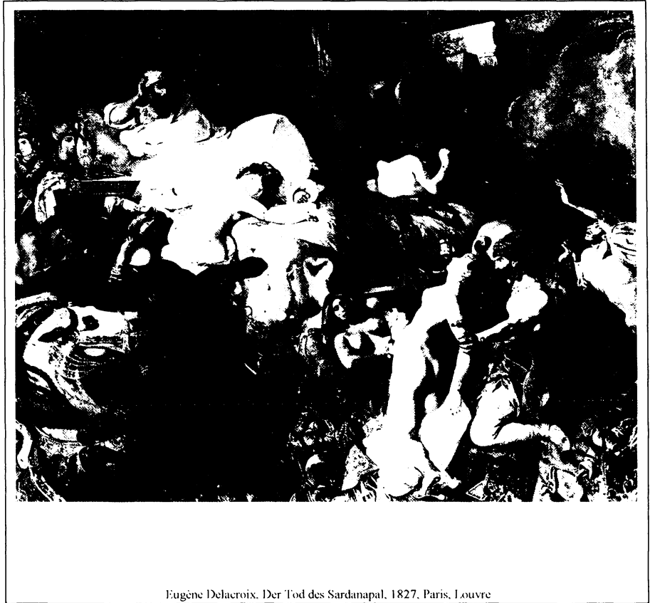
Eugène Delacroix. Der Tod des Sardanapal, 1827, Paris, Louvre

Jals künstlerisches Credo ist hier auf den Punkt gebracht. Wichtig ist für ihn die Idee, die hinter dem Werk steht, das weltanschauliche oder politische Bekenntnis,