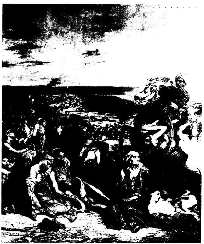
Eugène Delacroix, Das Massaker von Chios, 1824, Paris, Musée du Louvre