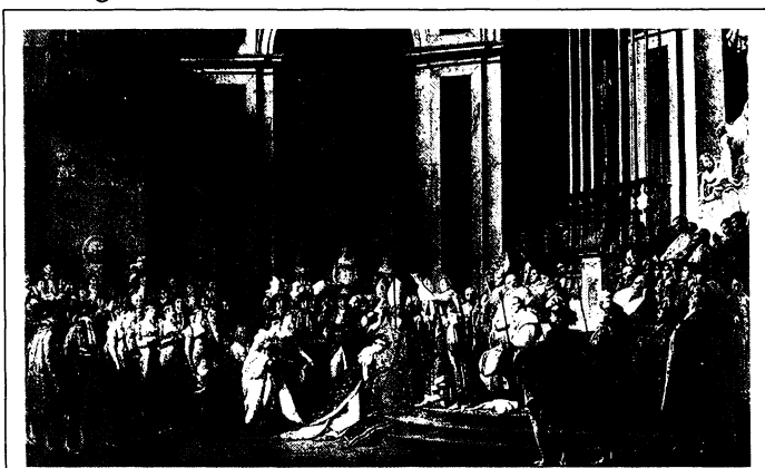
Jacques-Louis David, Die Weihe des Kaisers Napoleon und die Krönung der Kaiserin Josephine am 2. Dezember 1804, 1805, 1807, Paris, Musée du Louvre

Auch hier wieder bietet ihm David mit dem naturalistischen Zugriff seiner Krönung Napoleons (Abb. rechts) eine bewundernswerte Alternative. 52