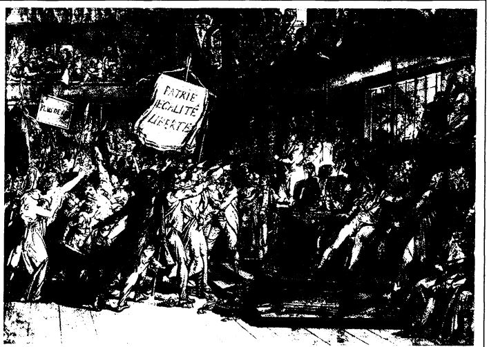
François Gérard, Das französische Volk verlangt am 10. August 1792 die Absetzung des Tyrannen, Paris, Louvre, Cabinet des dessins

An mehreren Stellen spielt der Kritiker den bürgerlichen Charakter der eingeklagten aktuellen Malerei gegen das vorherrschend aristokratische Element des Sacre aus. 46 Er reiht sich damit indirekt auch in die große Zahl derjenigen ein,