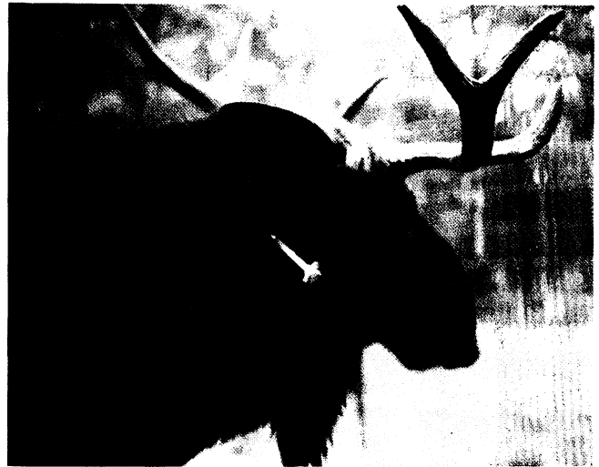
Abb. 1: Beschußzone am Hals

Durch den Zusatz von einer Ampulle Kinetin® (= 150 I.E. Hyaluronidase) kann die Anflutungszeit um ca. ein Drittel verkürzt werden, was vor allem die Arbeit bei der Nachsuche in freier Wildbahn wesentlich erleichtern kann.