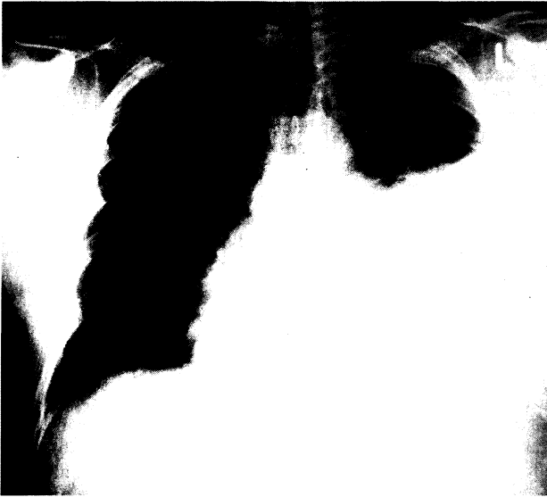
Abb. 1. Massiver linksseitiger Pleuraerguß bei interstitieller Pneumonie