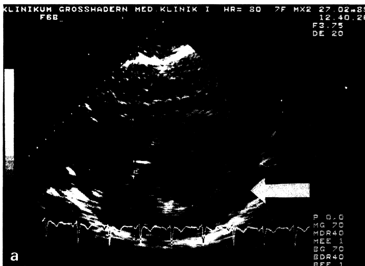
Abb. 2. a In der echokardiographischen 2D-Darstellung von subxiphoidal Nachweis eines deutlichen, um das gesamte Herz herum reichenden Perikardergusses; b im entsprechenden M-Mode Perikarderguß als echofreier Raum prä- und retrokardial (1–2 cm), beginnendes „swinging heart“

Nachdem sich der Patient bei Aufnahme noch in adäquatem Allgemeinzustand befunden hatte, verfiel er im weiteren Verlauf zusehends. Remittierendes Fieber bis 40° C, steigende Leukozyten bis 20 G/l, atemabhängige Thoraxschmerzen sowie eine respiratorische Insuffizienz (p a O 2 minimal 55 mmHg unter 4 l O 2 per Nasensonde)