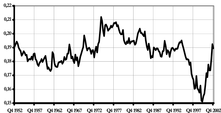
Abb. 2: Konsum als Anteil am Nettovermögen der US-Amerikanischen Haushalte Quelle: Board of Governors of the Federal Reserve System (2003) und Datastream, eigene Berechnungen