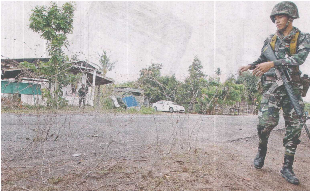
TENTERA Thai berkawal di sempadan Thailand-Kemboja sejurus sebelum pertelingkahan antara kedua-dua buah negara tercetus.

Language Page No Article Size Color ADValue PRValue Malay 22,23 1031 cm 2 Full Color 8,964 26,892