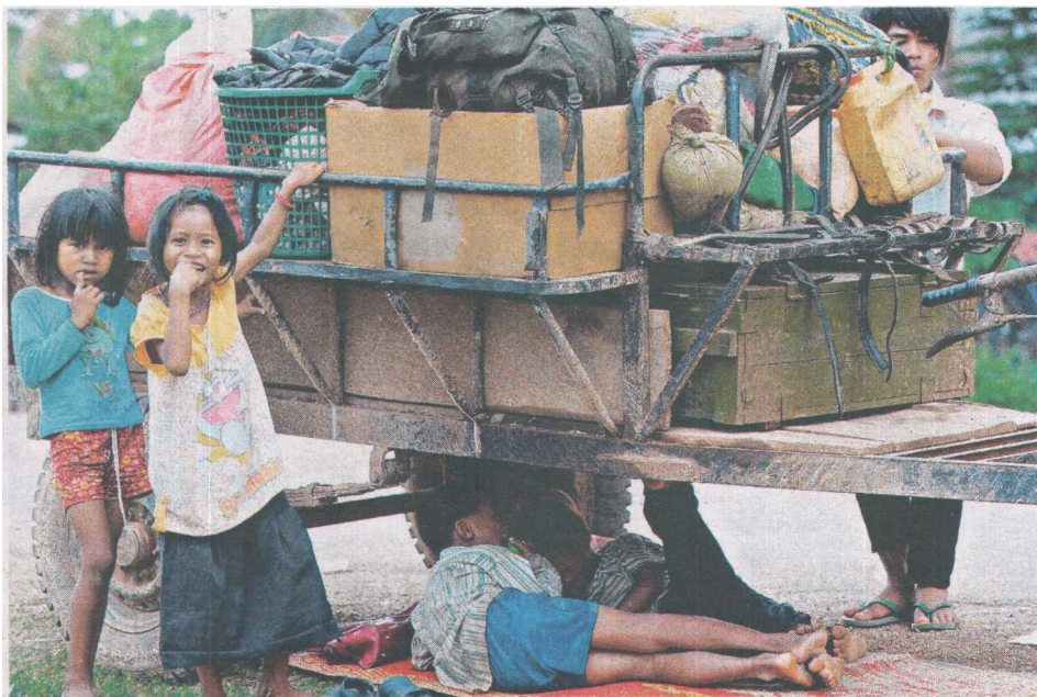
PENDUDUK di wilayah Samrong, Oddar Meanchey di Kemboja terpaksa meninggalkan kampung halaman mereka akibat pertelingkahan antara Thailand- Kemboja.