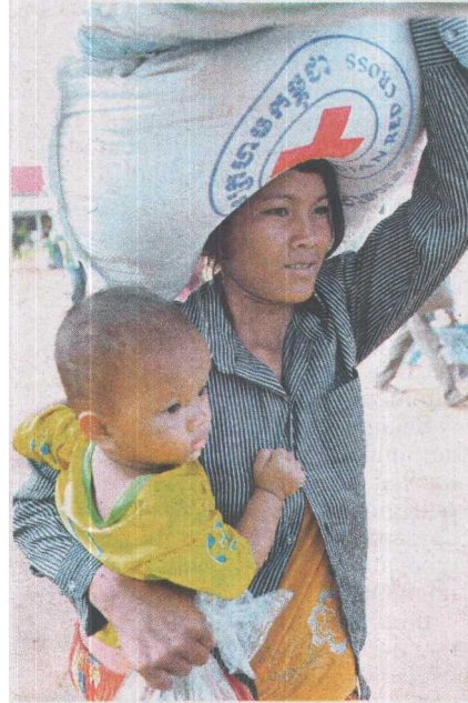
WANITA Kemboja ini membawa bekalan makanan yang diterima.