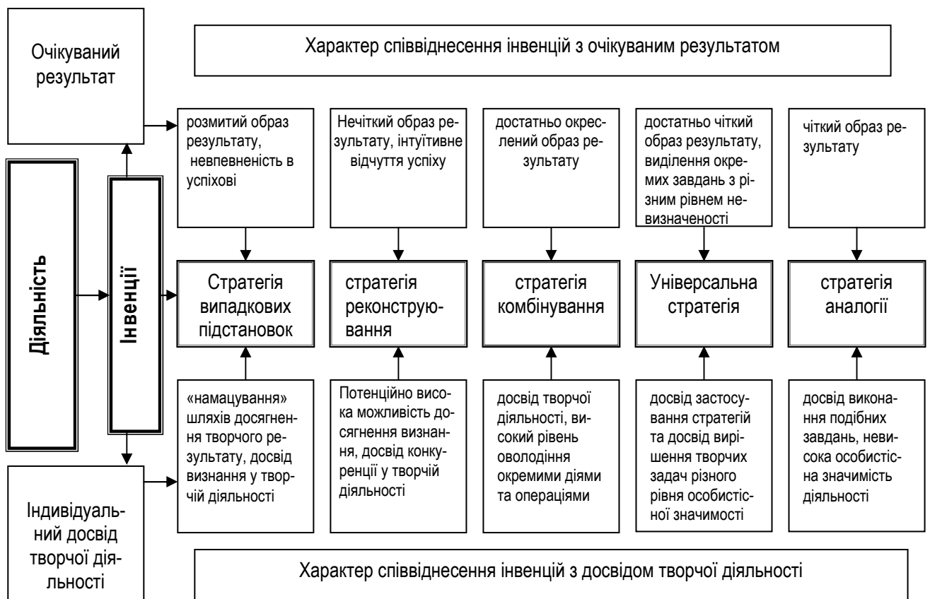
Рис. 2. Особливості включення інвенцій у творчу діяльність

Накопичений досвід і здатність прогнозувати результат – ці дві особливості людини як суб'єкта творчого процесу лягли в основу пропонованої нами моделі включення інвенцій у творчу діяльність (рис.1.).