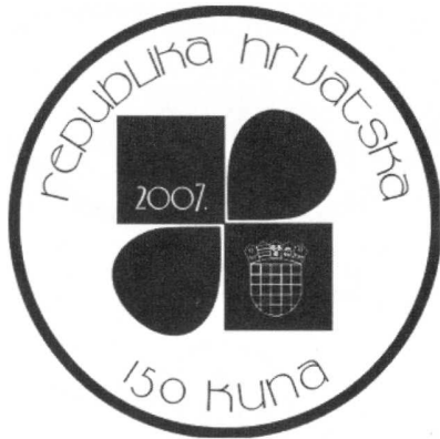
Slika 13: Skica reversa za prigodni novac denominiran u kunama (Hrvatska)