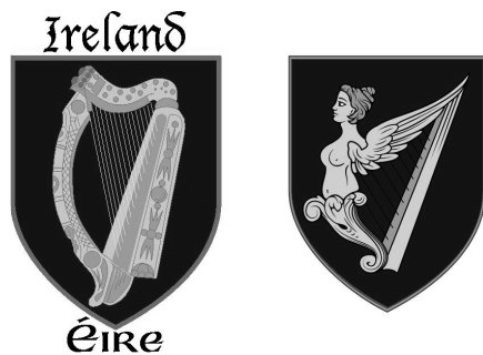
Slika 5: Povijesni grb Irske