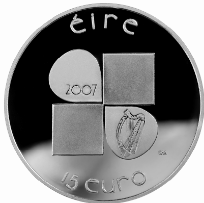
Slika 3: Revers irskog izdanja prigodnog novca nominalne vrijednosti 15 €

postavljenom na desnoj strani nalazi se irski grb 16 . Uz gornji rub kovanice stoji natpis “Eire” (na keltskome Irsko), a uz donji rub je oznaka nominalne vrijednosti – “15” i novčane jedinice - “euro” 17 . Inicijali autora nalaze se na desnoj strani kovanice (slika 3).