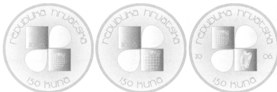
Slika 10: Skice reversa za prigodni novac denominiran u kunama (Hrvatska)