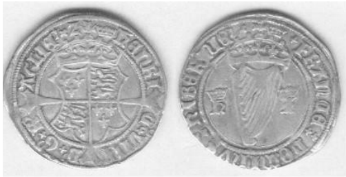
Slika 4: Henry VIII Half Groat oko 1534. godine