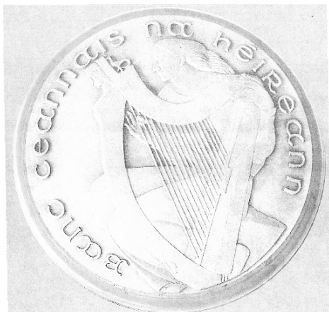
Slika 6: Izvorni predložak aversa kovanice