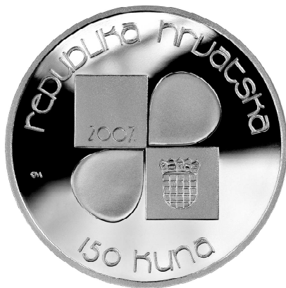
Slika 2: Revers hrvatskog izdanja prigodnog novca nominalne vrijednosti 150 Kn

hrvatskog grba. Uz gornji rub kovanice se nalazi natpis “Republika Hrvatska”, a uz donji oznaka nominalne vrijednosti – “150” i naziv novčane jedinice – “kuna”. Inicijali autora naličja kovanice i cjelokupnog dizajna novca profesora Damira Mataušića, akademskog kipara (DM) nalaze se na lijevoj strani kovanice (slika 2.).