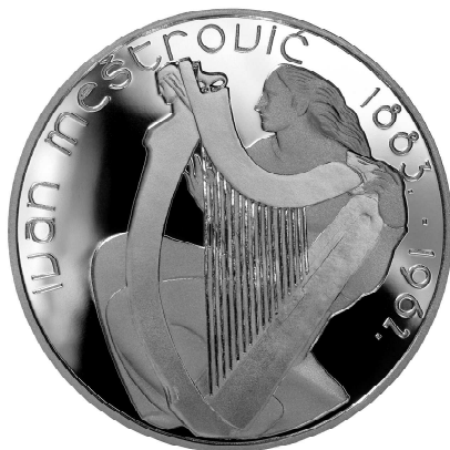
Slika 1: Zajednički avers prigodne kovanice nominalne vrijednosti 150 kn ili 15 €

Naličjem (reversom) hrvatske kovanice dominira svojevrsan “četverolist” sačinjen od dva naizmjenično postavljena kvadrata (simbol Hrvatske) i dva lista djeteline (simbol irske). U gornjem lijevom kvadratu se nalazi godina izdanja 2007., a u donjem prikaz