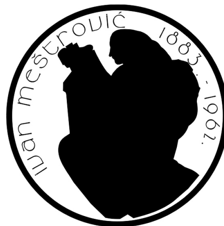
Slika 7: Zajednički avers crno bijelo

Prvu grupu čine skice i neusvojeni dizajn zajedničkog aversa prigodnog kovinskog novca (slike 6.i 7.)