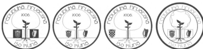
Slika 9: Skice reversa za prigodni novac denominiran u kunama (Hrvatska)