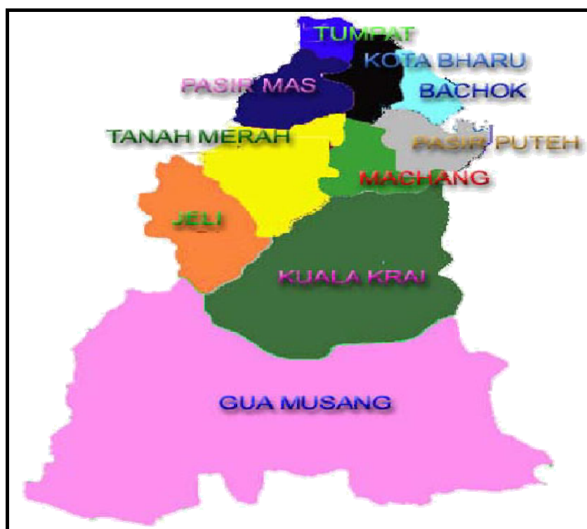
Rajah 1: Peta Negeri Kelantan menunjukkan Lokasi Jajahan Kuala Krai

Kedudukan jajahan Kuala Krai daripada pusat bandar Kota Bharu adalah sejauh 75 km. Jajahan Kuala Krai mengalami pembangunan yang agak pesat sejak beberapa tahun kebelakangan ini, yang mana banyak kawasan perumahan dan perniagaan baru didirikan. Justeru, hal ini telah mengakibatkan kemerosotan kualiti alam sekitar setempat kerana banyak kawasan hutan telah diterokai bagi memenuhi tujuan pembangunan tersebut.