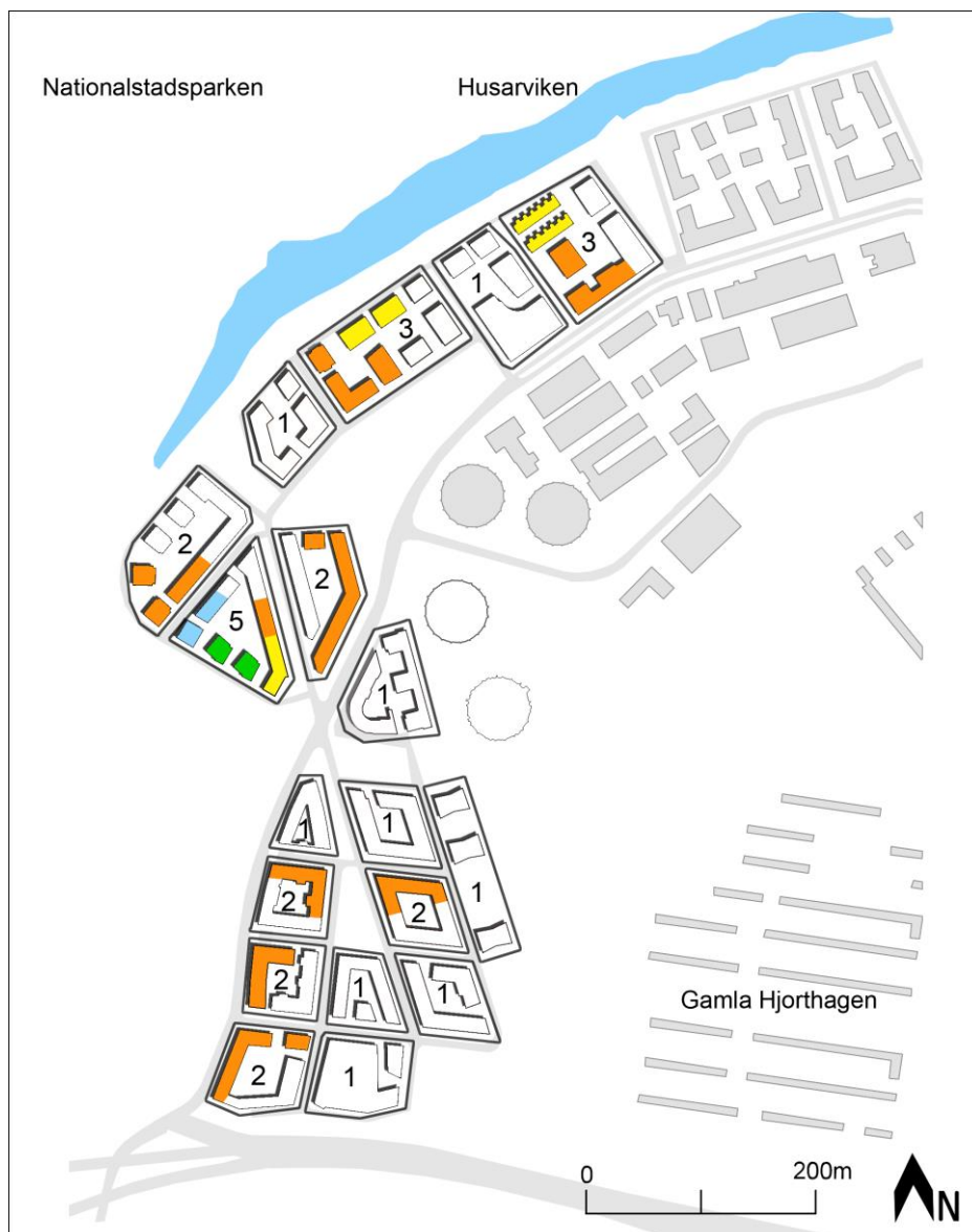
Figur 3. Siffrorna i kvarterens mitt visar antalet byggherrar som ansvarar för varje kvarter. Varje färg indikerar en enskild byggherre i vardera kvarter.

Norra Djurgårdsstaden är idag ett av de största stadsutvecklingsprojekten i Europa (Företagsgruppen Norra Djurgårdsstaden 2009). Därför kan det ses som ett storskaligt stadsbyggnadsområde och med ett sådant projekt finns det en risk att arkitekturen blir monoton och utan tydlig karaktär (Carmona et al s.264). Stockholms stad har försökt undvika dessa risker på flera olika sätt. En åtgärd är att man har delat in stadsbyggnadsprojektet med Norra Djurgårdsstaden i flera delområden där varje område är uppdelad i etapper (Stockholms stad 2012a). De innefattas i sin tur av flera kvarter (Stockholms stad 2012b). Vid undersökning av de olika etapperna upptäckte vi skillnader i de arkitektoniska uttrycken (Stockholms stad 2008b, 2009, 2012c, 2012d). Kvarteren med byggstart mellan åren 2010-2011 har en mer enhetlig arkitektur utan direkta visuella överraskningar, medan kvarteren som planeras byggas 2013-2014 har en mer innovativ gestaltning (Torsvall, Kärsten, & Barthel 2012).