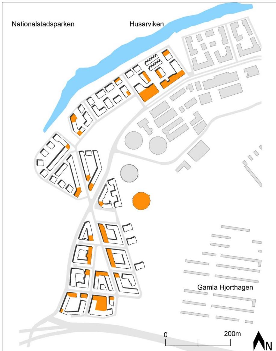
Figur 5. Bilden presenterar med orange färg vart i kvarteren det planeras för verksamheter i markplan.

Vid ett platsbesök vid de idag färdigbyggda kvarteren i etappen Norra 1, konstaterades att bottenvåningarna längs kvartersgatorna inte är gestaltade för verksamheter. Lokalerna är endast gestaltade för bostäder då de har en sockelhöjd på ungefär 1,5 meter och saknar en tilltagen takhöjd. För att främja en god grannsämja har Stockholms stad planerat in gemensamhetslokaler i samtliga bostadshus (Torsvall, Kärsten, & Barthel 2012). Det påverkar den sociala hållbarheten på ett positivt sätt då det bidrar till ett utökat lokalt föreningsliv och skapar en möjlighet till ett tryggare boende (Carmona et al 2010, s.55).