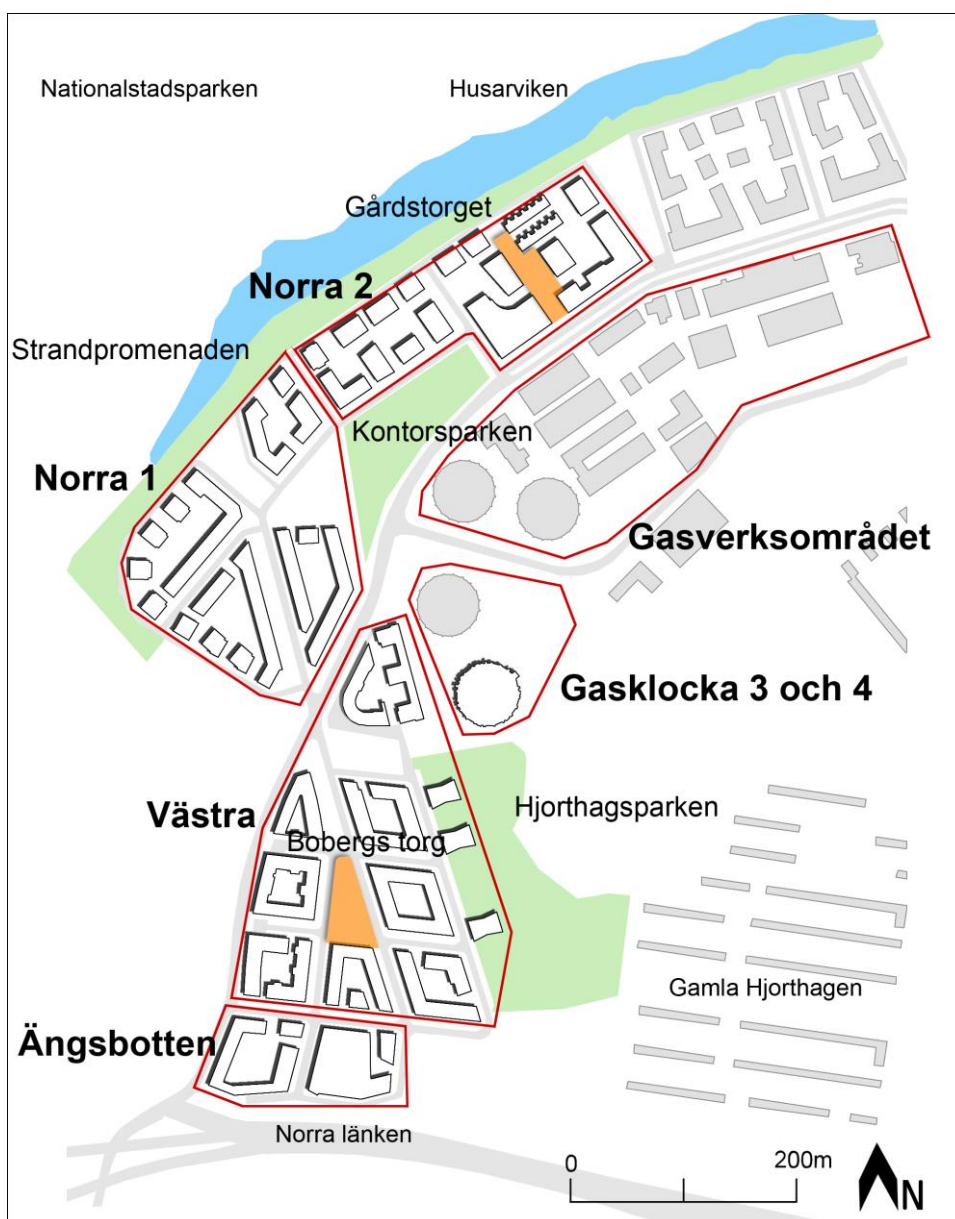
Figur 2. Bilden presenterar Hjorthagens samtliga etapper, torg och parker som behandlas i uppsatsen.

I resultatavsnittet presenteras hur faktorerna fastighetsindelning, kvartersformer, boendeformer och ekonomi och mötesplatser i utemiljön har konkretiserats i de detaljplanerade delarna av Norra Djurgårdsstaden. Varje faktor redovisas under varsin rubrik. I fastighetsindelningens resultat har vi valt att bortse från Gaslocka 3 och 4. Det beror på att området består av befintliga byggnader och därav inte behandlas av Stockholms stad på samma sätt som övriga kvarter i stadsdelen. Gasverksområdet presenteras endast i avsnittet Mötesplatser i utemiljöer eftersom det området saknar detaljplan och endast har ett gestaltungsprogram för den yttre miljön.