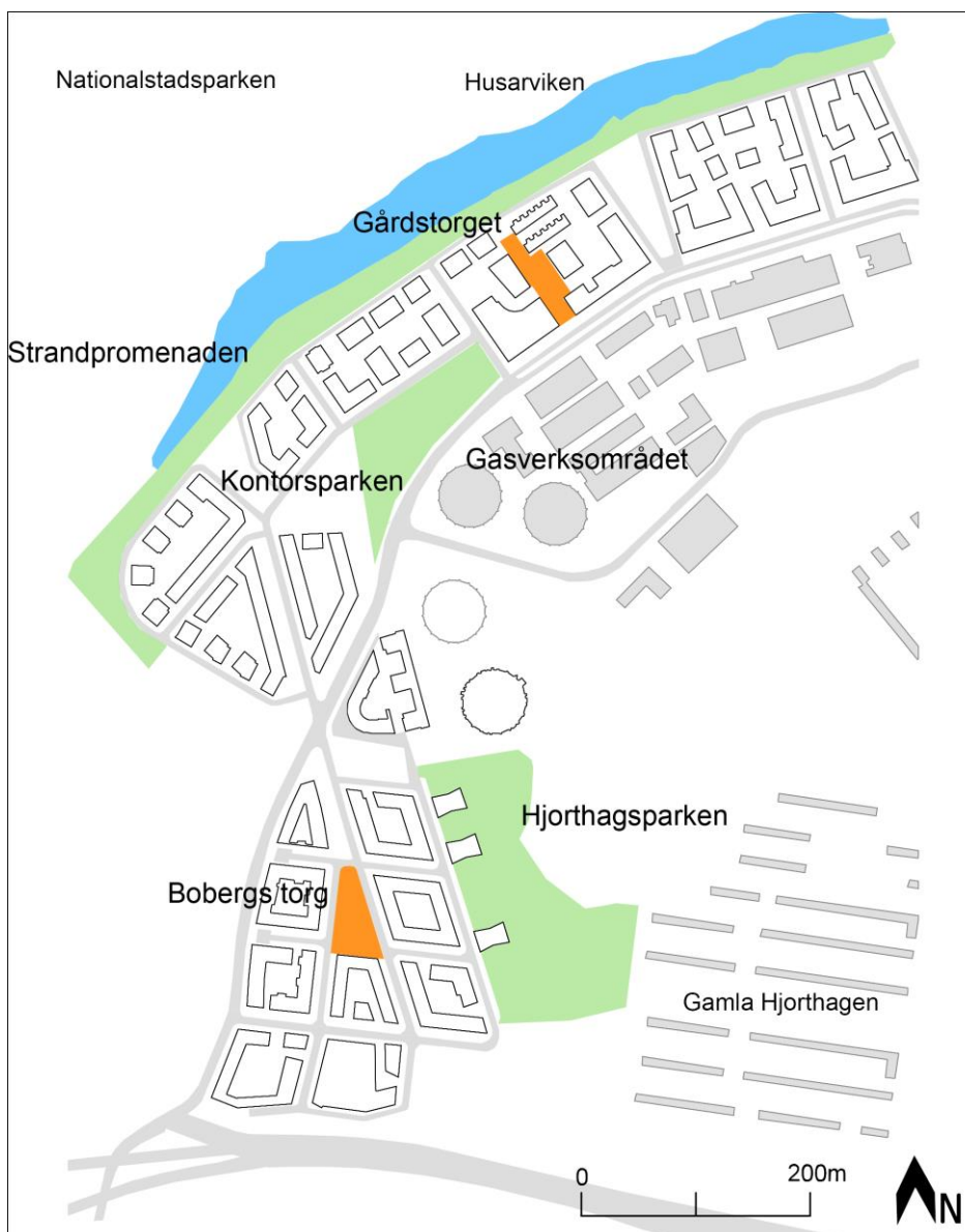
Figur 6. Bilden presenterar de utemiljöer i form av parker, torg och områden som vi har granskat i uppsatsen.

utkiksplats, spontanidrott, stigar och sittplatser (Grontmij 2012). Den blandningen av aktiviteter är enligt Anders Rasmusson, chef för Movium, positiv för social hållbarhet (Rasmusson 2012). I presentationen av parkens utformning uttalar dock landskapsarkitekterna att aktiviteterna ska koncentreras till tydligt avgränsade platser för att skapa en tydlig gräns mellan natur och byggd miljö (Grontmij 2012). Det innebär att man delar upp funktionerna på platsen vilket kan leda till att färre möten uppstår och på så sätt motverkas den sociala hållbarheten.