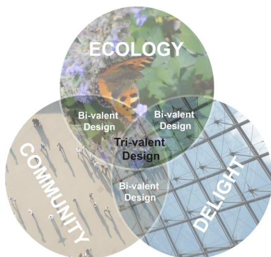
Illustration och foton: Jonna Blomfeldt

producera och uppnå produkter av hög kvalitet. Thompson (1999, s. 4) definierar begreppet värde som "the relative status of a thing, or in the estimate in which it is held, according to its real or supposed worth, usefulness, or importance". Värde innebär därmed någontings uppskattade faktiska eller förmodade värde, nytta eller betydelse. Thompson (1999, s. 153) anser att de tre värdena ekologi, social medvetenhet och estetik är jämbördiga. De allra bästa projekten i landskapsarkitektur anser Thompson maximera samtliga tre värden (Thompson 1999, s. 190). I arbetet ses Thompsons slutsatser som likvärdiga med de som gäller för god landskapsarkitektur.