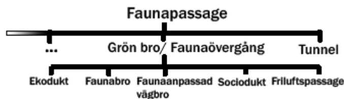
Illustration: Jonna Blomfeldt

Banverket och Vägverket (2005, s. 44) skriver att samtliga passager över och under väg är viktiga för djurlivet, även om bästa möjliga förhållanden inte alltid erbjuds.