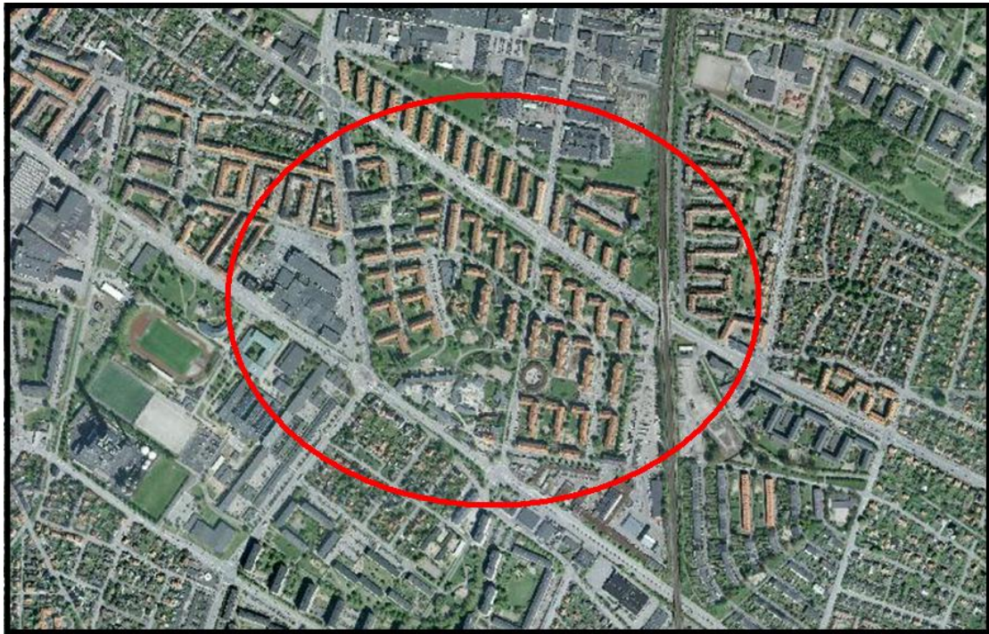
Satellitbild över Ekostaden Augustenborg

Denna del presenterar ett konkret fall – Ekostaden Augustenborg och beskriver bakgrundsfakta om området och projektet.