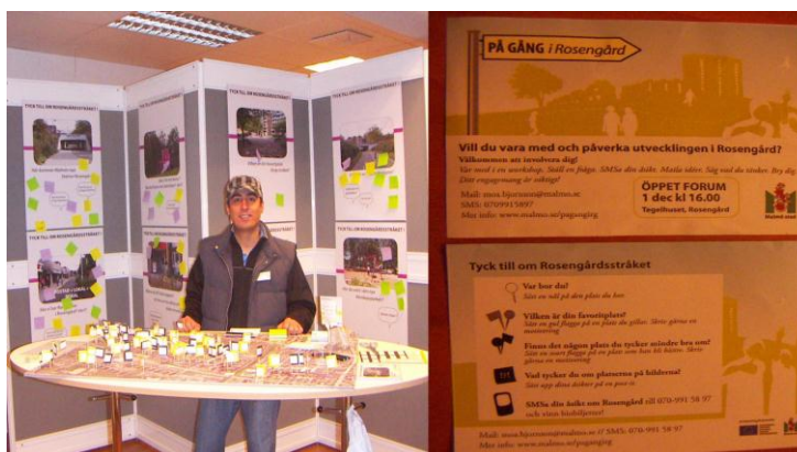
Figur 4. Projektet Stadens Ljus: Rosengård .