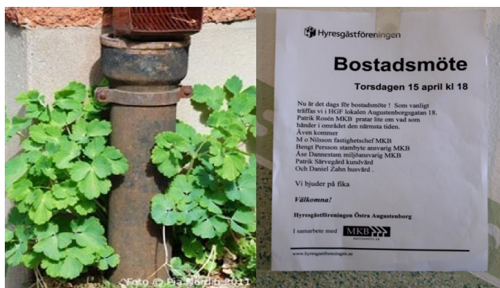
Figur 2. Bostadsmöte om stambyte den 15 april 2010 uppsatt i en trappuppgång.

1 – Bostadsmöte på Augustenborg den 15 april 2010.