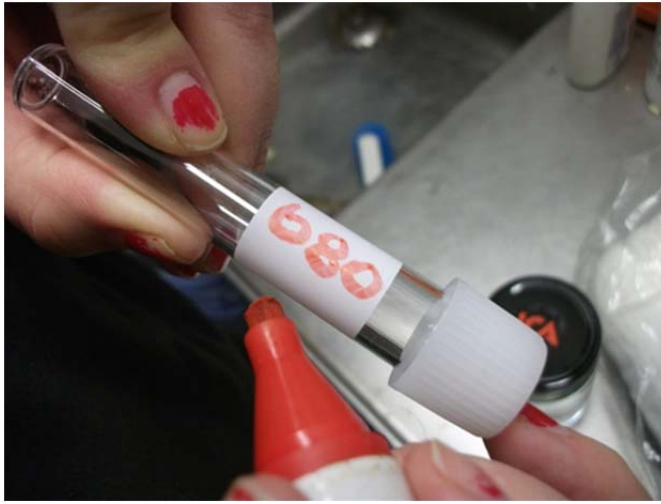
Figur 4. Noggrant dokumenterades vilken ko och vilken spene som provtogs.