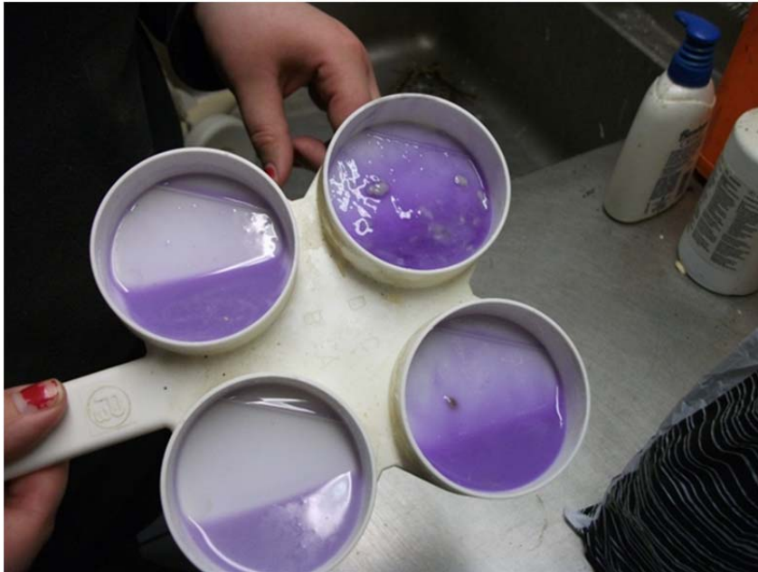
Figur 3. CMT test. Spene vänster fram (figur: övre höger) är mycket kraftigt förändrad och man kan se flock, bedöms som kategori 5. Spene vänster bak (figur: övre vänster) lite förändras, bedöms som kategori 2. Spene höger fram (figur: nedre höger) förändrad mjölk, bedöms som kategori 3. Spene höger bak (figur: nedre vänster) oförändrad, bedöms som kategori 1.