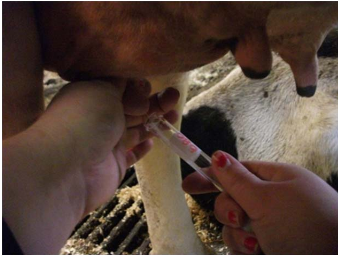
Figur 6. Korken på provröret togs av precis innan provtagning skedde och röret hölls så horisontellt som det gick för att undvika kontaminering.