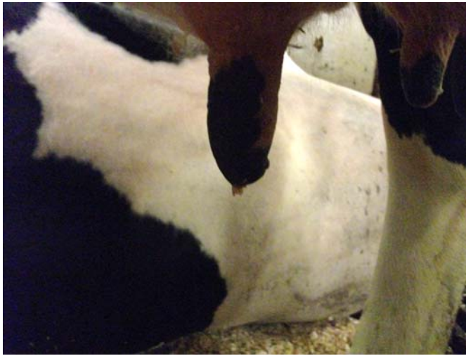
Figur 1. Spenspetsen på den vänstra spenen är väldigt skadad.

Mjölkkörtelens egna immunförsvar kan delas in i två olika grupper, medfött och specifikt immunförsvar. Det medfödda immunförsvaret är det som är på plats först för att bekämpa en infektion. Det medfödda försvaret finns redan i spenen och vid spenkanalen. Om bakterier tar sig igenom upp i juvret går det specifika försvaret till angrepp. Vid snabb elimination av en infektion tack vare det medfödda immunförsvaret märks det knappt hos kon. Det specifika försvaret har ett minne, så om kon drabbas av samma infektion två gånger kommer försvaret ihåg hur bakterierna fungerar och kan eliminera infektionen mycket snabbt (Sordillo och Streicher, 2002).