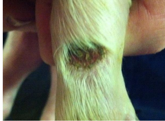
Bild 1: Typiska sår på knäna efter cirka en vecka. Bild 2: Närbild på sår.