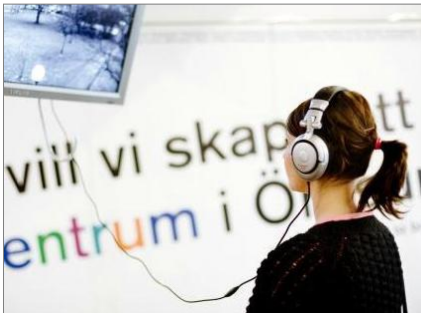
Ett betydelsefullt kommunikationsnav var H+ utställningen på SHIP, på Bredgatan i Helsingborg.

Engvall menar trots detta att SHIP är den kreativa plats där flest medborgardialoger ägde rum, dit många olika människor kom och delade med sig av sina skilda perspektiv 119 :