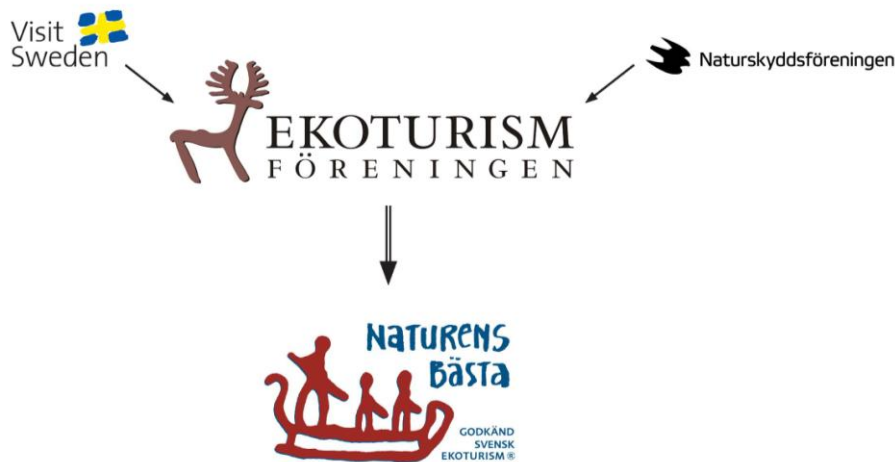
Figur 2. Figuren visar de organisationer som ligger bakom Naturens Bästa. Samtliga logotyper används med vänligt tillstånd från organisationerna.

gemang ska få märkningen måste de uppfylla ett antal grundkriterier och bonuskriterier. Svenska ekoturismföreningen är huvudman och även initiativtagare till Naturens Bästa (Naturens Bästa 2004b). De står tillsammans med Naturskyddsföreningen och VisitSweden bakom märkningen.