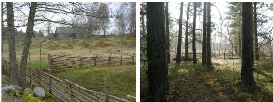
Gården i Sjögetorp är belägen mitt bland tallskog och betade backar med stenrösen.

Företaget Urnatur blev godkänt inom kvalitetsmärkningen Naturens Bästa 2008 och är beläget i Sjögetorp sju kilometer utanför Ödeshög i Östergötland (Urnatur, u.å.b). Simonsson och Lagervall (1998, s. 3) beskriver naturen kring Sjögetorp som betade backar och lövskogsängar med stora gamla ekar, björk, hassel och asp. Detta varvas med tallhedar och kärr. Vidare beskriver de enbackar och små åkerlappar med stenrösen som vittnar om det bondesamhälle som en gång fanns här. Både flora och fauna är artrika och härstammar från slätten och skogen.