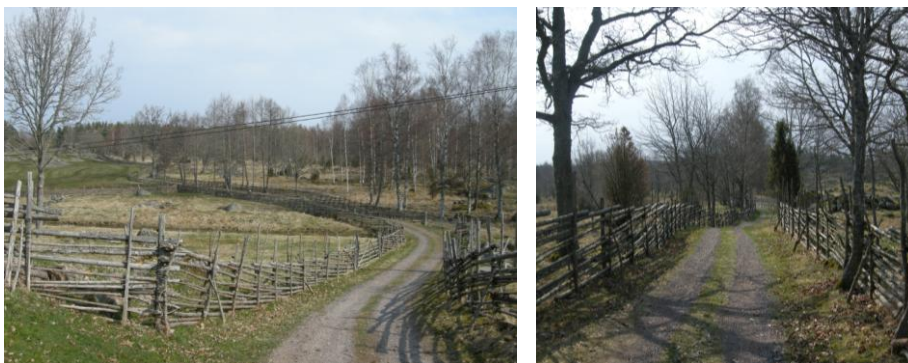
Fägatan som sträcker sig mellan gården och skogseremitaget.