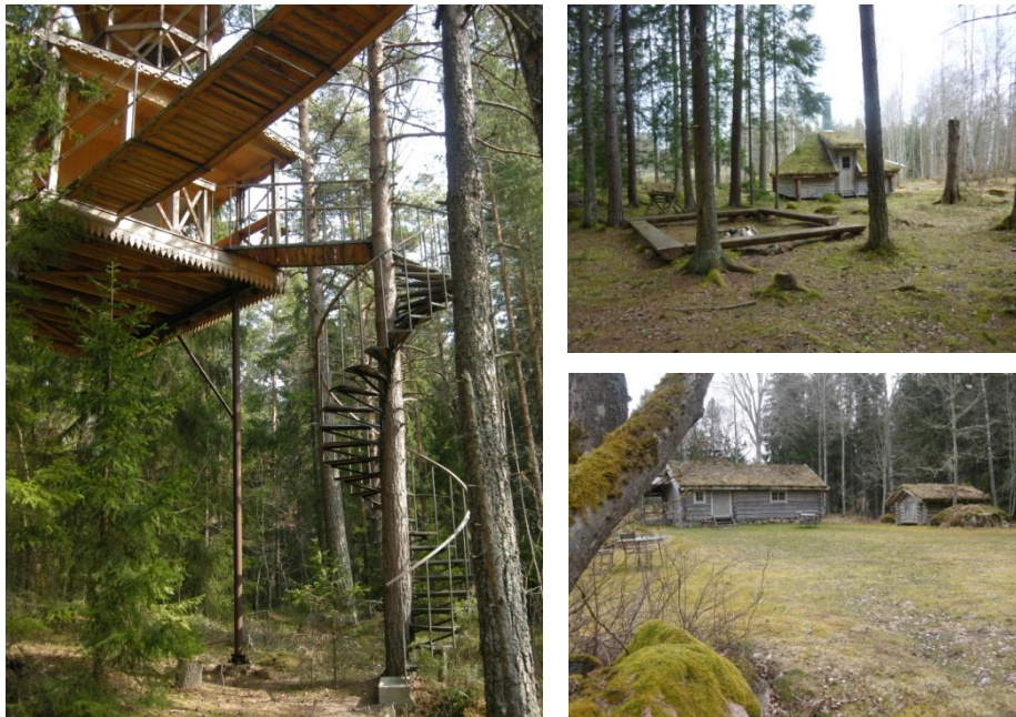
Alla stugor är unika och har tilldelats olika namn. Till vänster Luftslottet, i övre högra hörnet Vargkåtan och i nedre högra hörnet Storstugan.