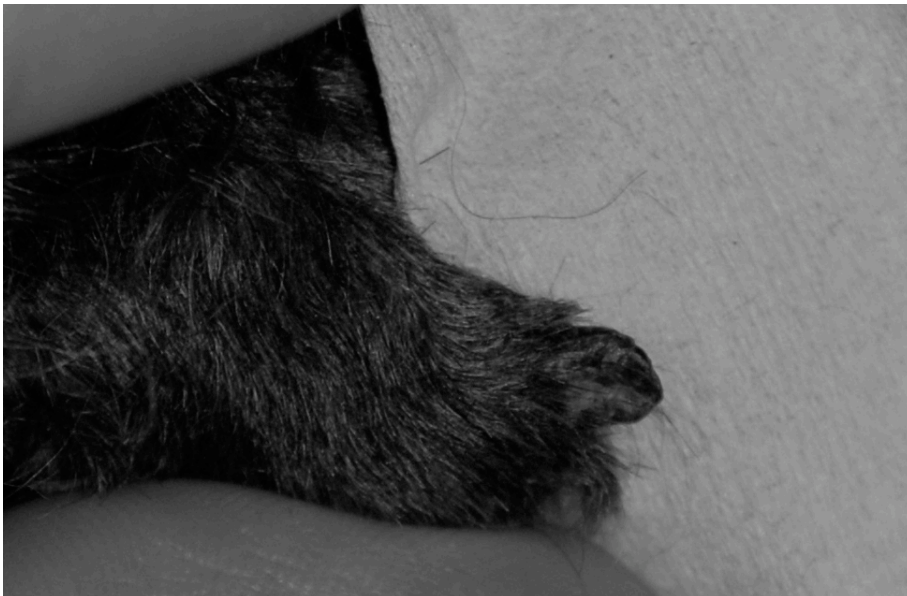
Figur 2. Dystrofisk klo efter avlossning hos toypudel under behandling.

Alla hundar i artikeln av Scott, Rousselle och Miller (1995) sökte veterinär på grund av problem med klorna och var i övrigt friska. Det första fyndet var vanligen en separation i klobädden och att en eller flera klor avlossats. Hos cirka 50 % av fallen var tillståndet smärtsamt med olika grader av hälta och smärtreaktioner vid palpation. I studien beskrevs resterande 50 % verka omedvetna om sin sjukdom. Fyra av 18 hundar hade illaluktande, pyohemorrhagisk vätska från klobalsen, troligen på grund av sekundärinfektion. De nya klor som växte ut var missformade, mjuka, torra, sköra och ofta missfärgade. Se figur 2. (Scott, Rousselle och Miller 1995)