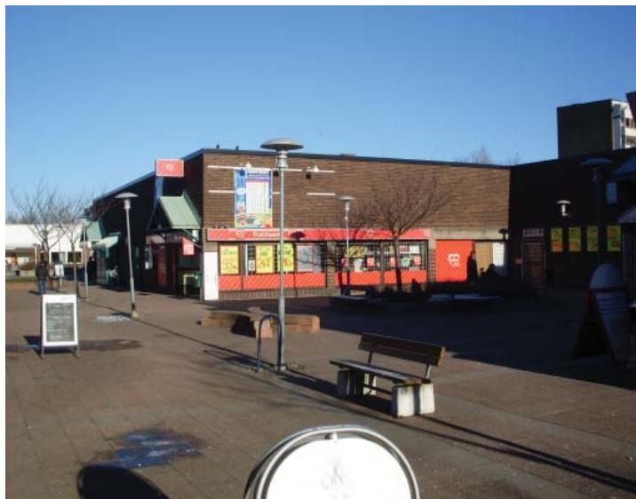
Bild 3: Nydalastigen, eller Fosiestråket i riktning mot Lindängens centrum.