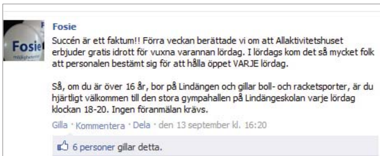
Bild 10: Ett urklipp från Fosies Facebooksida. (www.facebook.com)