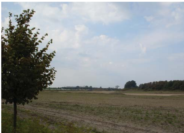
Bild 6 och 7: Rekreationsområdet Lindängelund som det ser ut idag.