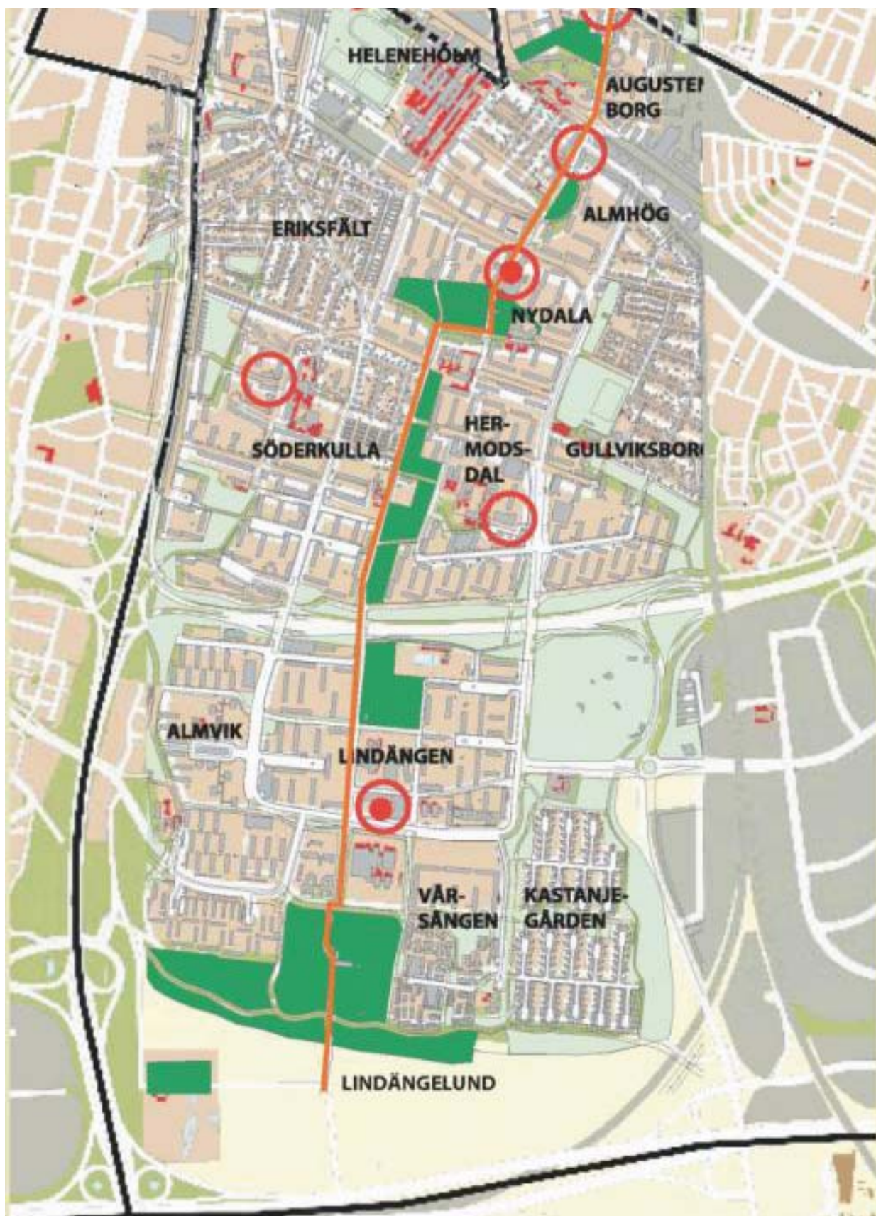
Fosiestråket/Nydalastigen med stadsdelen Fosies olika områdestorg/centrum och större grönområden utmärkta ( http://www.malmo.se ).