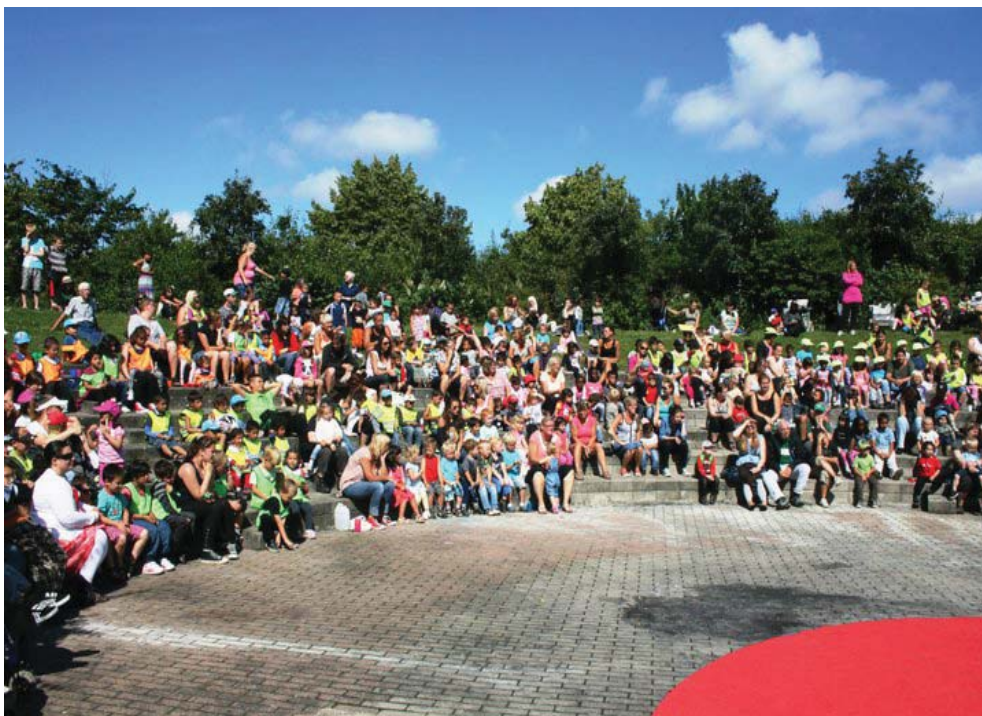
Bild 5: Amfiteatern i parken Lindängen är välbesökt.