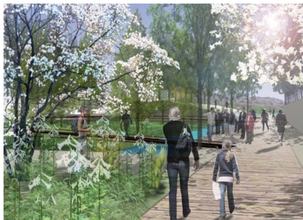
Bild 8 och 9: Malmö stads visionsbilder för parken.