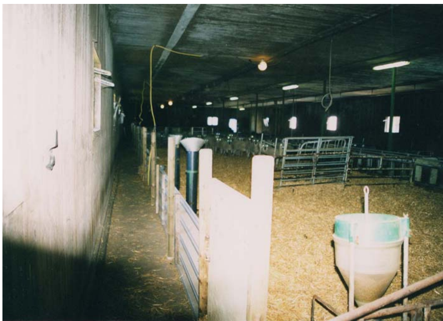
Figur 22. Inspektionsgången är väldigt bra att ha dels för att flytta djur vid exempelvis vägning men även för att se djuren bakifrån när de äter. Man sätter lammningsboxarna intill för att enkelt kunna ha uppsikt över nyfödda lamm men även lammande tackor. Som boxvägg används här en självbärande högprofilplåt som hålls på plats med åttakantiga tryckimpregnerade stolpar som är nergjutna i golvet.