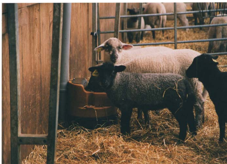
Figur 2. Lamm som dricker ur en eluppvärmd vattenkopp. Koppen har en öppen vattenspegel och rensas minst en gång per dag.

Utfodring av kraftfoder och grovfoder sker mestadels för hand, men till en del av djuren ställs en rundbal in i boxen. Alla stora boxar har eluppvärmd vattenkopp som matas av en vattenslang med värmeslinga (se figur 2).