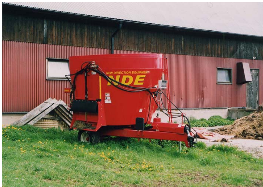
Figur 9. Den nya mixervagnen från NDE är effektivare men kräver en extra elevators för att få upp fodret på elevatorsfoderbordet.