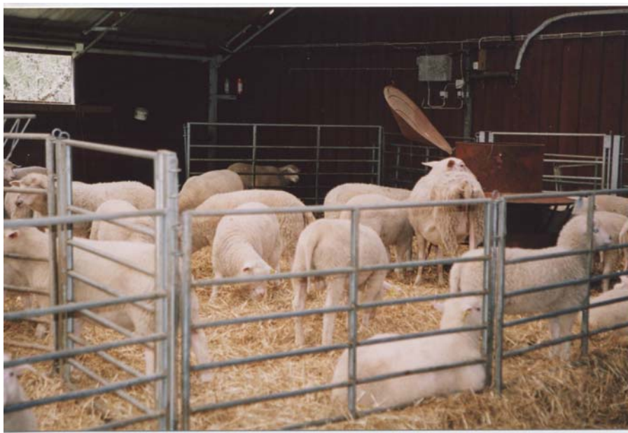
Figur 1. Fina frånskilda lamm hos Kjell och Majbritt. En torr och ren ströbädd betyder mycket för djurhälsan och arbetsmiljön i stallet. Till höger i bilden ser man en kraftfoderautomat och på väggen sitter centralen för vatten och värmeslinga.

Tackorna har fri tillgång på grovfoder och får kraftfoder efter hur långt de är i dräktigheten. Tackorna hullbedöms regelbundet när man utfodrar djuren. Detta gör också att djuren blir tama och lättare att hantera.