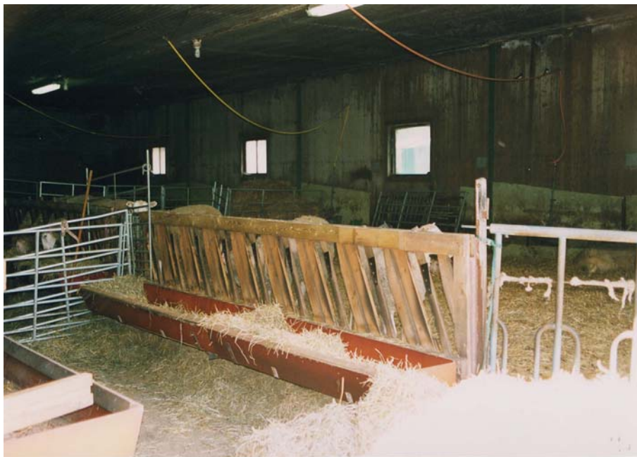
Figur 21. Bilden visar hur Smålandsgrinden är konstruerad. Tackorna trycker den smala brädan i sidled och när de äter kan de inte dra tillbaka huvudet utan att lyfta det. Denna fodergrind hindrar effektivt lammen från att komma ut på foderbordet.