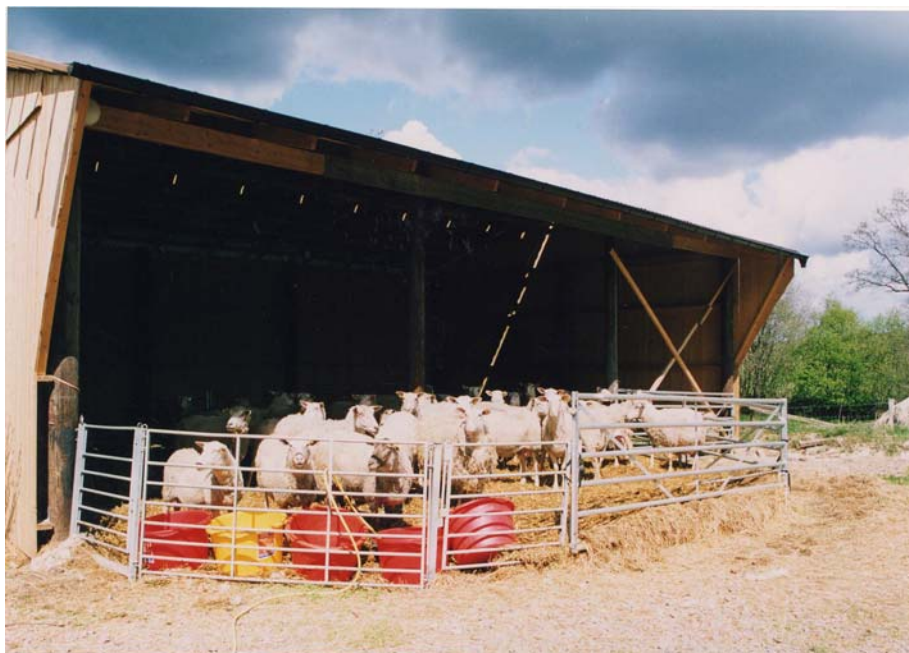
Figur 4. Enkel byggnad för sintackor hos Kjell och Majbritt.