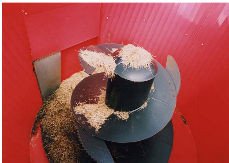
Figur 10. Den nya mixervagnen har en stående skruv och därmed sönderdelar den fodret snabbare än Seko Samurajen som har två liggande knivförsedda skruvar. Då denna vagn trycker fodret uppåt får man se till att man inte överfyller den, gör man det kan fodret trilla ur.