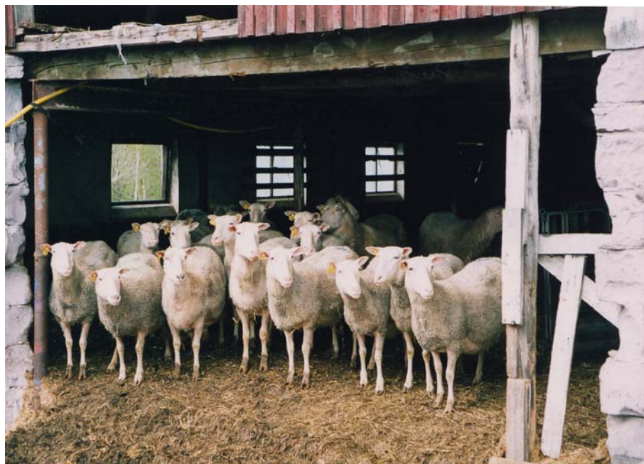
Figur 5. Renrasiga finullstackor i ett gammalt stall hos David Wiliams. Genom att bara plocka ut några fönster ur en byggnad kan man få ett behagligt klimat till fåren.

Även rena finullstackor för avel används (se figur 5). För att få tidiga lammningar korsar han finull och dorset och av dessa blir det moderdjur som betäcks med texel. För att få bra livdjur skall man använda sig av en högrest lång dorset. David har 250 tackor och 7 baggar (se figur 6).