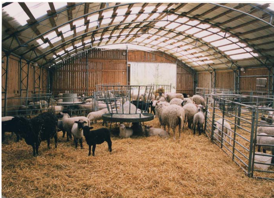
Figur 3. Fåren trivs i ljusa och luftiga byggnader hos Kjell och Majbritt. Stommen i byggnaden är en gammal tälthall som köpts in.

Byggnaderna på gården är ljusa och luftiga, Taken består av plåt med en stor del ljusinsläpp. Alla tak är försedda med kondensväv på insidan. Väggarna består av trä för att få ett levande material som inte bildar kondens utan i stället buffrar fukten. Det finns flera byggnader på gården och de är sammanbyggda i ett system för att enkelt kunna flytta djuren mellan dem. I centrum finns en utlastningsbox dit alla slaktdjur drivs för att underlätta lastning på slaktbilen.