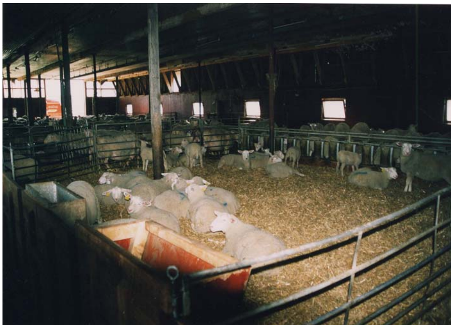
Figur 12. Fotografiet är taget ifrån inspektionsgången och i mitten av stallet ser man elevatorfoderbordet. Foderbordet kommer ifrån Albouy Equipment, Baraquelle, Frankrike