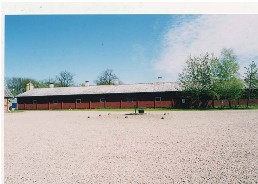
Figur 18. Före detta svinstall som nu används till fårstall på Konga gård.

Fåren inhyses i ett ombyggt svinstall från 60-talet (se figur 18). Stallet består av 2 avdelningar. Det är ett isolerat stall med undertrycksventilation. Eftersom det är ett gammalt stall väsnas fläktarna mycket. För att slippa den höga bullernivån används inte fläktarna, istället har en del fönster plockats bort och några står öppna.