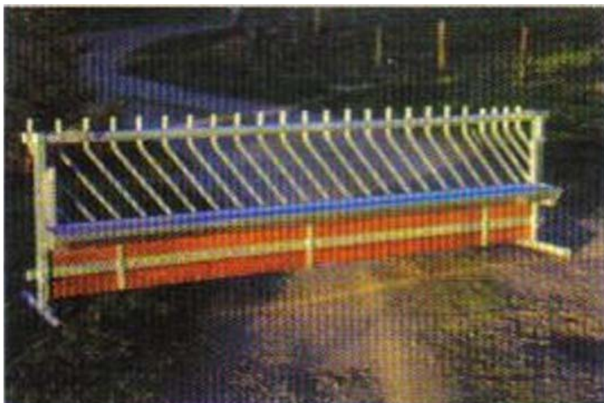
Figur 14. Frontgrind Beweka används hos Magnus Skyllert. Grinden gör att lammen inte kan hoppa ut på foderbordet. Hängd på grinden finns en ränna för kraftfoder. Rännan är uppfällbar vilket gör att man kan bygga en grovfoderkrubba framför grinden. Grinden är stegvis höjbar för att kunna hänga med djupströbädden när den växer. Bilden är hämtad ur Fårskötsel nr 6:2001.

Alla djur har fri tillgång på grovfoder i form av rundbalar som körs in med lastmaskin. Magnus har satt in cirkulerande vatten för att slippa detta annars tunga arbete.