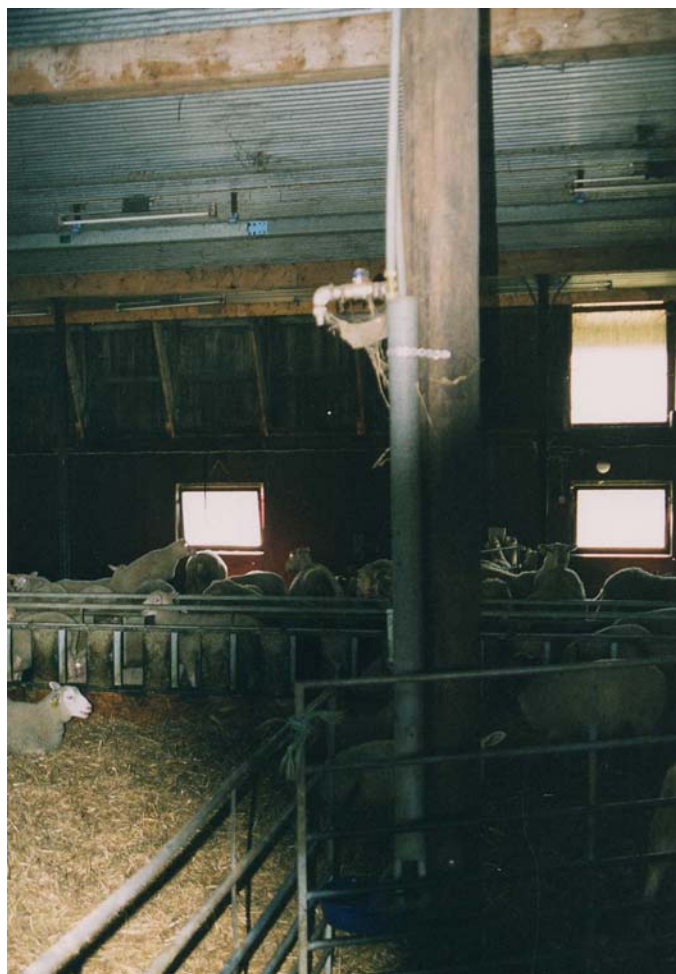
Figur 13. David har ett cirkulerande vattensystem. Bilden visar en vattenkopp och en kran. Kopparna sitter med jämna mellanrum i stallet, samtliga är utrustade med kran för att kunna ge vatten till djuren i lammningsboxarna.