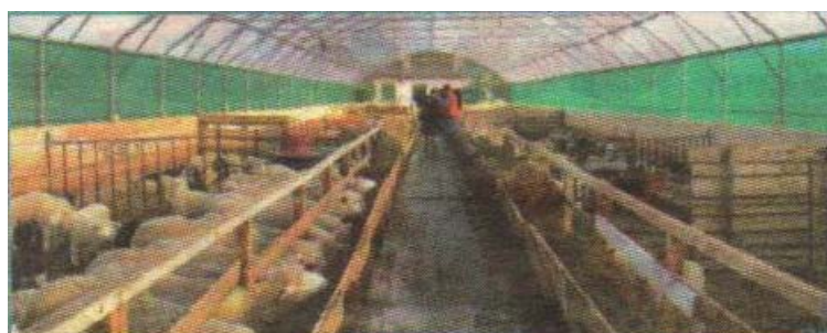
Figur 23. Så här kan ett växthus som används till får se ut. För att slippa kondens är det viktigt att man får ordentlig luftgenomströmning. Detta uppnås bäst med hjälp av vindnät. Man kan även installera en motor som rullar upp näten om det skulle behövas en varm dag (se figur 15). För att få ett bra klimat i växthuset bör man ha en öppennock. Bilden är en annons från UBA – Uno Borgstrand AB, den är tagen ur ATL maj 2005.

Ytbehovet för får varierar i de skrifter jag läst. Enligt jordbruksverkets rekommendationer skall en dräktig tacka som går på ströbädd och väger 75 kg ha 1,7 m 2 . Ett lamm över 15 kg kräver 0,5 m 2 . Lammkammare skall finnas med 0,2 m 2 per lamm. En lammningsbox skall vara 1,2*1,2 kvadratmeter. Vid samtidig utfodring skall en tacka ha 0,4 meter rak foderhäck och 0,2 meter rund. Det skall finnas minst en vattenkopp per 50 tackor (ovanstående är hämtat ur Sjödin, 1994). Ett annat mått jag hittat är mellan 3-3,5 m 2 per tacka (Byggnader och Planlösningar 2001).