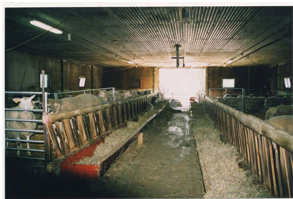
Figur 20 . Den del av stallet som är inredd med Smålandsgrinden. I foderkrubban sker utfodring av både grovfoder och kraftfoder. Även i denna del skall det installeras ett elevatorfoderbord.