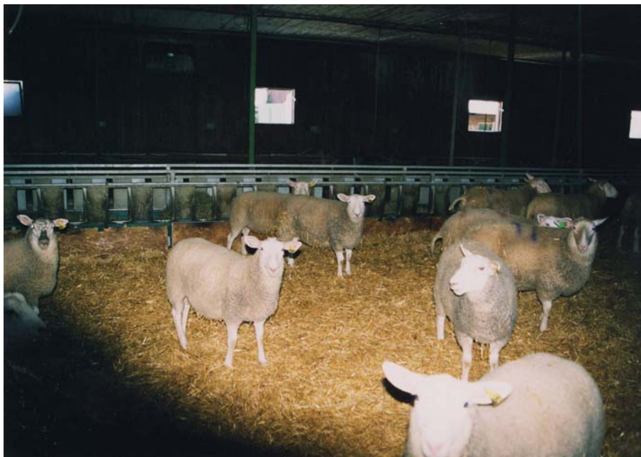
Figur 16. Avskilda lamm, elevatorfoderbordet ser man i bakgrunden. Foderbordet är en fransk konstruktion och kommer ifrån ett företag som heter Albouy Equipment.

Dödligheten totalt i besättningen ligger på ca 10 % där lammen utgör ca 8 %. Alla tackor avmaskas under säsongen. Vart annat år använder man Ivomec och vart annat år ett annat preparat.