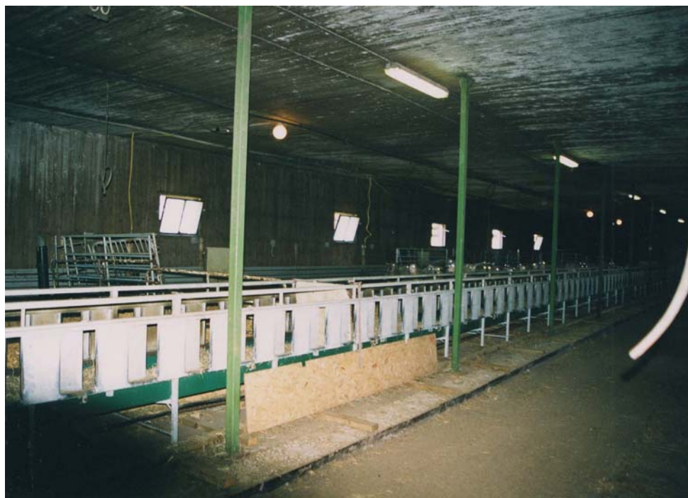
Figur 19. Elevatorfoderbord där utfodringen av ena delen i stallet sker. Även denna sida ifrån var kortet är taget skall fyllas med får.