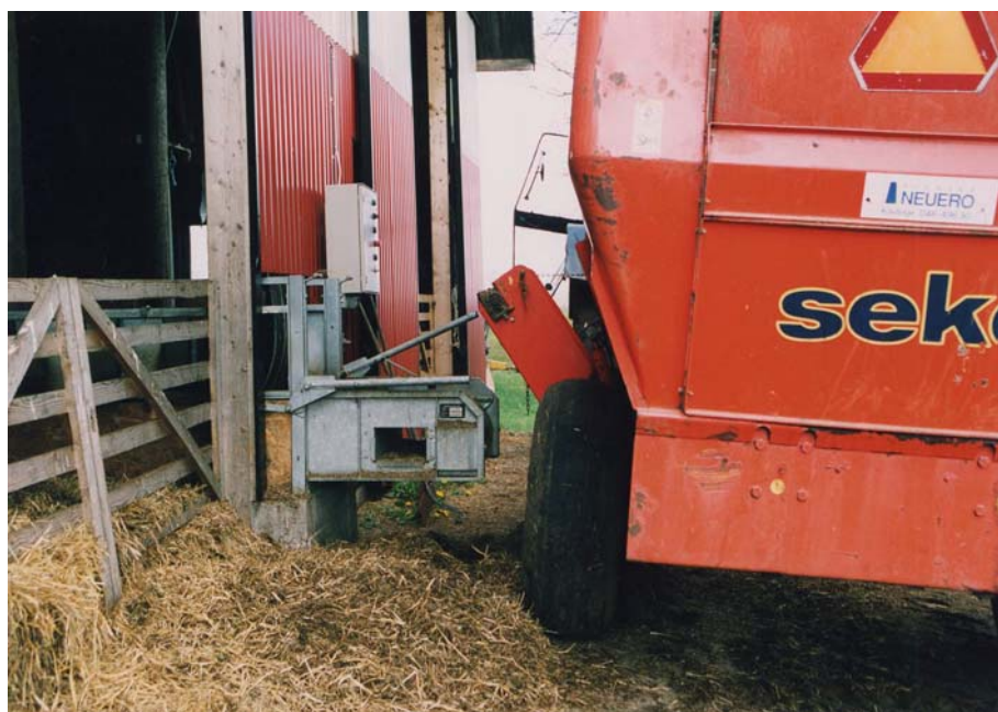
Figur 8. Här dockar mixervagnen till elevatorfoderbordet.