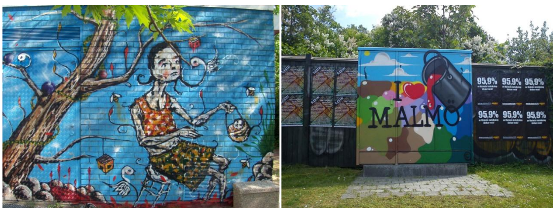
Elcentralen på Sevedsplan. Graffitisounds 2009, av Limpo (vänster).

I Trygghetsprogrammet menar Malmö stad att problemet är det som målas utanför dessa väggar. Angående graffiti står det bl.a. att tags går under benämningen klotter och är något som oftast förfular gatumiljön. Trygghetsprogrammet säger att polisens åsikt är att klotter ökar i närområdet av de lagliga väggarna och denna illegala verksamhet och vandalism ska motverkas, helst tas bort inom 24 timmar. Trygghetsprogrammet utgår ifrån forskning och hänvisar bland annat till Broken Windows theory (Wilson & Kelling, 1982), som menar att skräp föder skräp, dvs. att är en plats trasig och skräpig så eskalerar vandalismen ( Trygghetsprogram [online], 2011-05-18, s. 26). Graffiti användningen i Seved har delvis använts som ett sätt att minska klotter vilket går i linje med Malmö Stads syn på graffiti. Men Malmö Stads inställning till graffiti är samtidigt tudelad; å ena sidan menar Malmö Stad att graffiti är accepterat på vissa väggar å andra sidan att dessa väggar, enligt polisen, ger upphov till ökad vandalism.