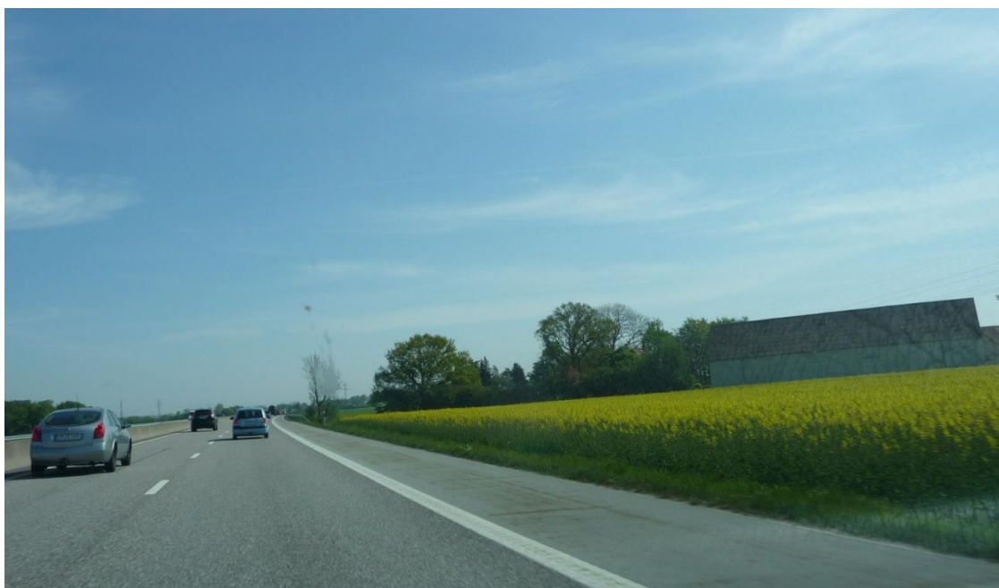
Figur 6 Ett blommande rapsfält längs E22 norr om Lund gränsar direkt till vägen, vilket gör att även skydds-zonen kan utnyttjas till jordbruksproduktionen.

en refug emellan körbanan och vägbanan. Ibland avskärmas gångvägen med hjälp av en häck, ibland finns här ett skyddande räcke och ibland, likt Figur 5 , finns bara en grässlänt med enskilda träd som avskiljare.