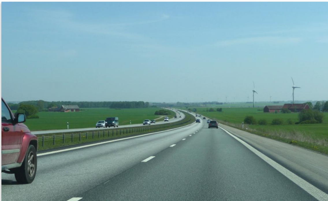
Figur 2 En satsning på mötesfria vägar har gjorts för att stoppa dödsolyckor i trafiken. Här på E22 norr om Lund omöjliggör ett vajerräcke kollision med mötande trafik.

Grunden för trafiksäkerhetsarbetet i Sverige utgörs sedan 1997 av nollvisionen (Vägverket, 2009, s. 2). Här delas ansvaret för säkerheten mellan utformarna och användarna av vägtransportsystemet, men det yttersta ansvaret har dock alltid utformarna, alltså främst väghållare, fordonsindustri, Polisen, politiker och lagstiftande organ (a.a s. 2 & 6). Vägtransportsystemet ska utformas med förståelsen av att människor gör misstag och att olyckor inte helt går att undvika, men dessa misstag ska inte leda till allvarliga personskador (a.a s.5). En stor del av dagens satsning för att göra vägarna säkrare handlar om att sätta upp trafiksäkerhetskameror, skapa mötesfria vägar och sätta upp sidoräcken (Trafikverket, 2010a, s. 11). Även den ökade mängden rondeller, samt en hastighetsanpassning, är ett resultat av detta arbete (Vägverket, 2009, s. 10).