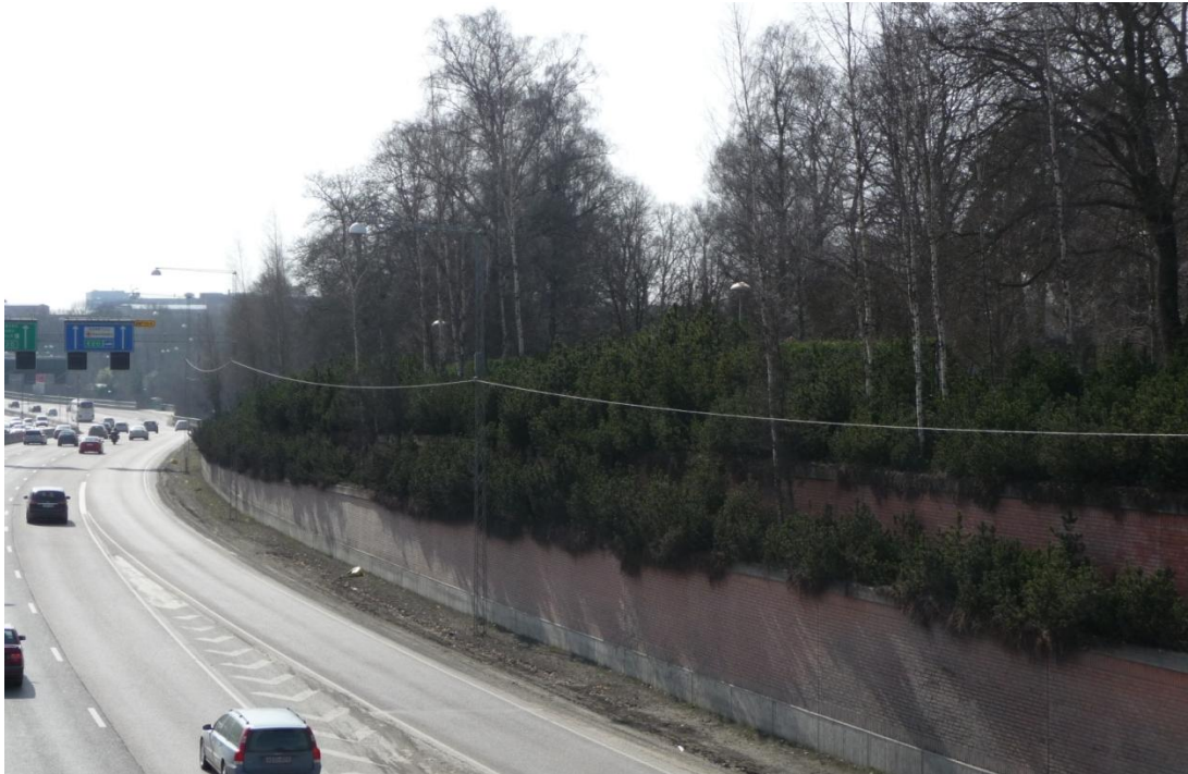
Figur 3 En mur vid E4 i Solna, Stockholm, som fungerar som bullerskydd, separering av motorvägen och bidrar till orienterbarheten för bilisten.

sig kan dock betydligt försämrats genom ett bullerskydd (Svenska kommunförbundet, 1998, s.80). Vid placeringen och utformningen av bullerskydd är det därför viktigt att hänsyn tas till trafik-säkerhet, landskapsbild samt värdefulla natur- och kulturmiljöer (Vägverket & Länsstyrelsen i Skåne län, 2004, s.20). Figur 3 visar ett bullerskydd längs E4 i Solna som kombinerar både vegetation och mur. Det säregna utseendet bidrar dessutom till att öka orienterbarheten för bilisten.