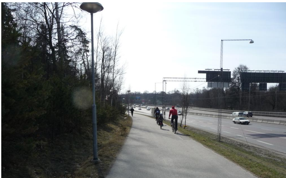
Figur 5 En gång- och cykelväg leder mellan Solna och Stockholm. Till vänster syns Hagaparkens kant och till höger E4:an. Vägbuller är här mycket påtagande.

fågelsång och känslan av vinddrag (a.a s. 8 & 38). Dessutom påverkas rörelsen längs vägen av bl.a. buller, avgaser och barriäreffekter.