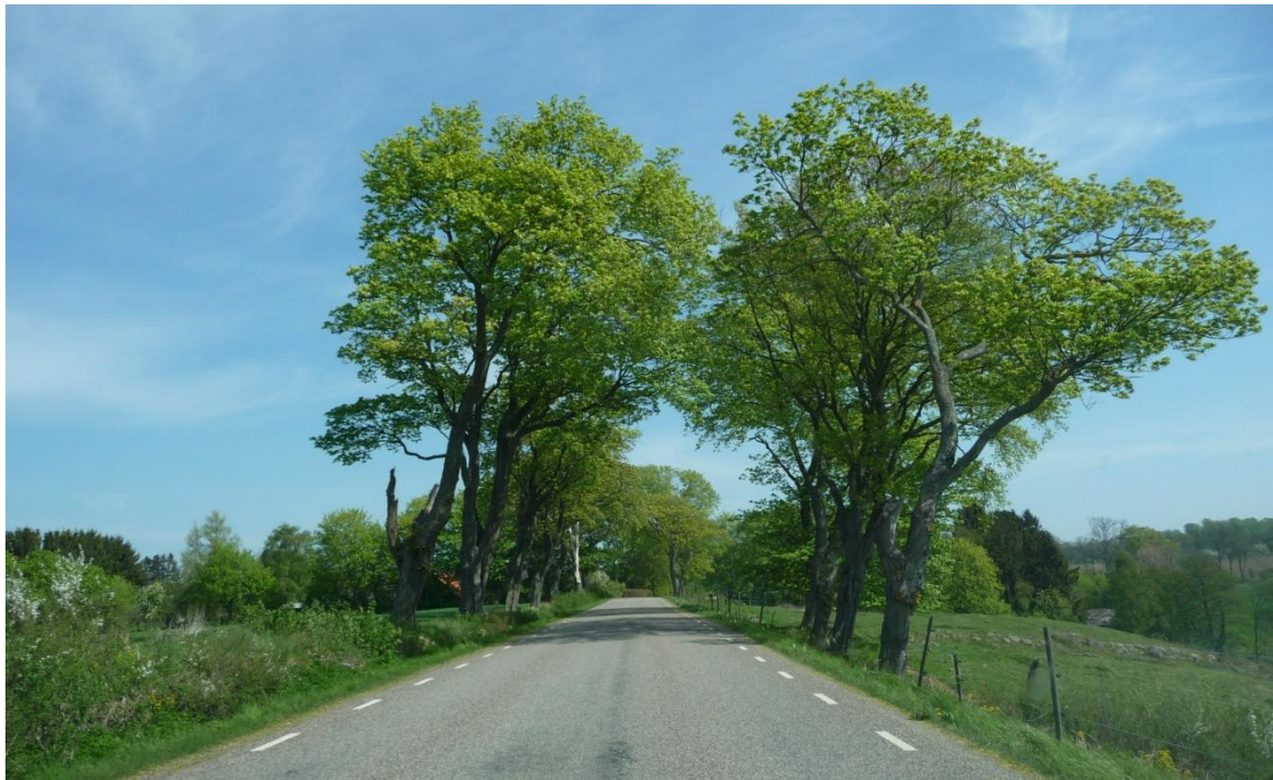
Figur 4 En gammal allé längs en landsväg norr om Harlösa, Skåne. Gamla alléer och vägträd fungerar som livsmiljö för många djur och växter och är ovärderliga för den biologiska mångfalden.

sidoområden nya linjära element som kan ge förutsättning för utveckling av nya biotoper. Vilken ekologisk påverkan vägarna har beror på vägnas och vägkanternas utformning och skötsel.