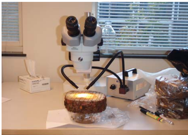
Bild 1. Stereomikroskop och trissa vid analysering.

Den andra insamlingen analyserades på likvärdigt sätt som tidigare gjorts.