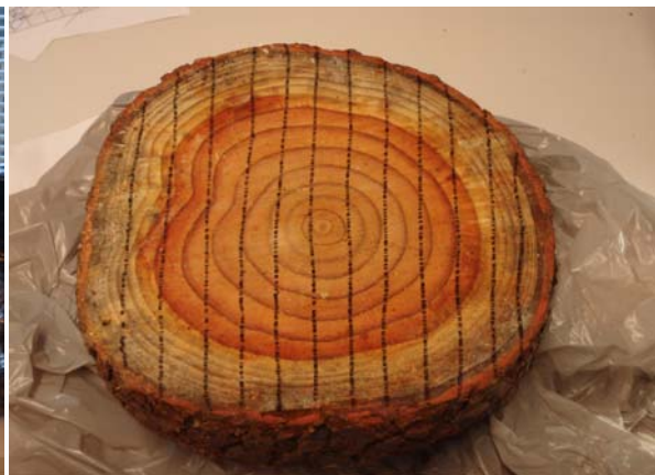
Bild 2. Hur trissorna märktes vid analysering.