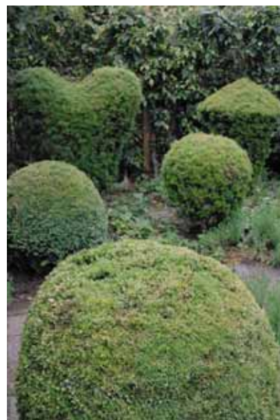
Formklippta buskar