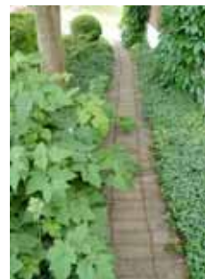
Gången i marktegel