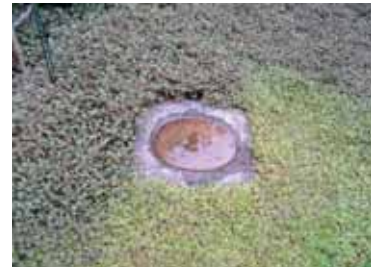
Fågelbad i sten nedsjunket bland marktäckarna hos Östbergs