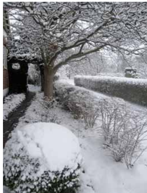
Ingång längs med husets gavel