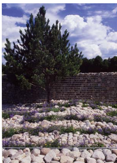
Den strama Heden.