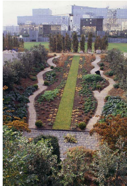
Den tredje trädgården från floden.

Den tredje trädgården från floden är jämfört med den föränderliga trädgården mer arkitektoniskt och de ekologiska värdena minskar men inom vissa gränser är naturen friväxande. I den mittersta trädgården tar det hårdgjorda alltmer över den friväxande naturen och tränger undan de ekologiska värdena. Växtmaterialet i den sjätte trädgården är ytterligare begränsat av trädäck och grus vilka placerats i raka och strikta former.