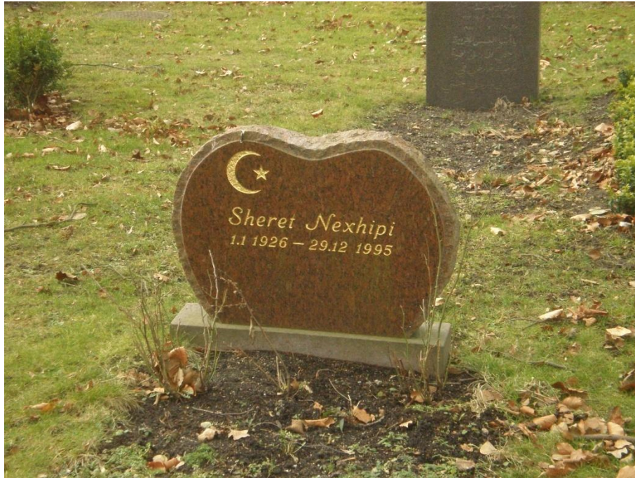
Gravsten från 1995 där formen har börjat bli friare och mjukare än det varit tidigare.