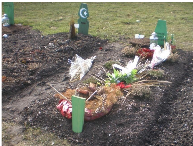
Nyanlagd muslimsk grav med gröna trämarkeringar för fot- och huvudändarna, samt något upphöjd jord.

Det är inom Islam väldigt viktigt att graven inte beträds, därför markerar man graven vid huvud- och fotändarna med gröna trämarkeringar. Dessa markörer byts i regel ut efter ett år mot mer traditionella gravvårdar av sten. (Kyrkogården, 2007) Ofta gör man gravarna upphöjda från den omgivande marken (Möller, 2001), eller omgivna av en ram av sten eller trä, för att gravarna ska bli extra markerade. Det är av den orsaken även