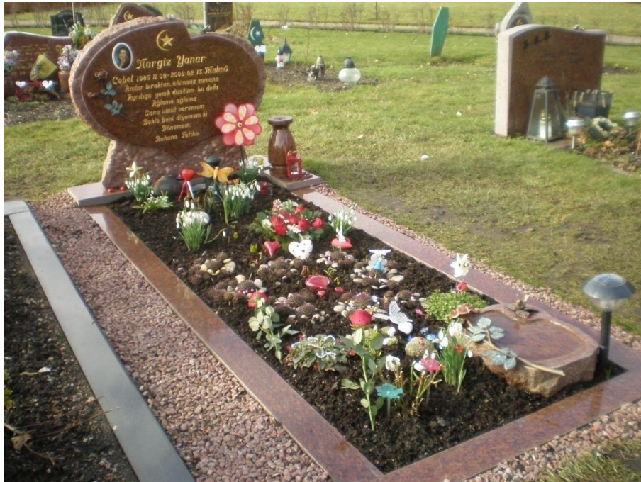
Gravplats från 2006 där utsmyckningen på både gravstenen och jorden är tydlig.