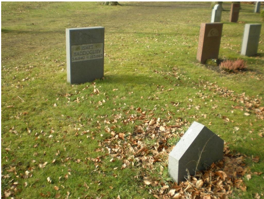
Gravplats från 1985 med enkel design.

Det finns även flera lyktor på gravstenen, vilket kan vara ett tecken på att de muslimska gravarna har blivit influerade av andras traditioner. Hela den inramade gravstenen är full av olika utsmyckningar som till exempel tuvor med snödroppar och taklökar, snittblommor, släta stenar, glaskulor i en mängd färger samt olika föremål i plast.