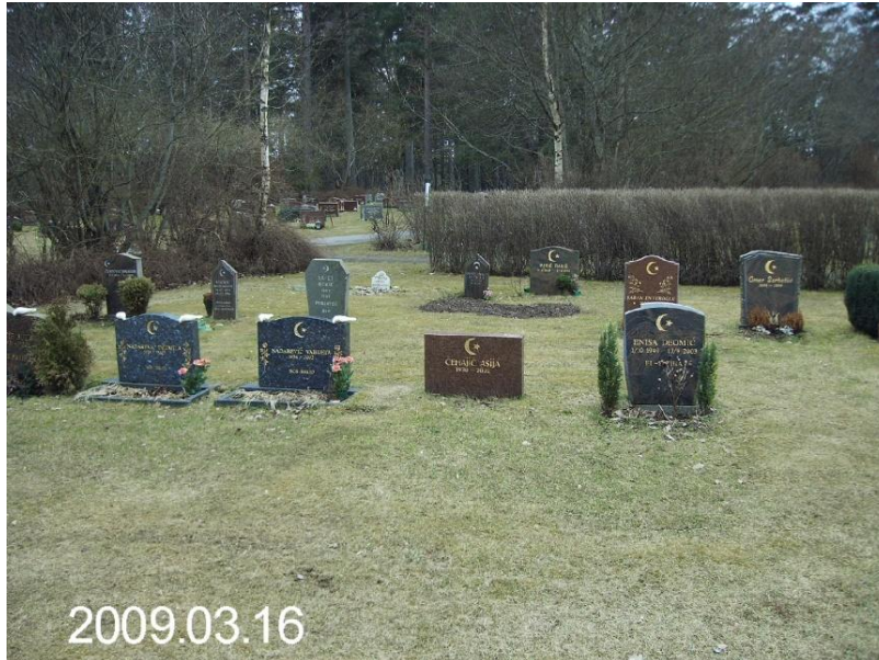
Översikt över den muslimska begravningsplatsen på Nybro kyrkogård.