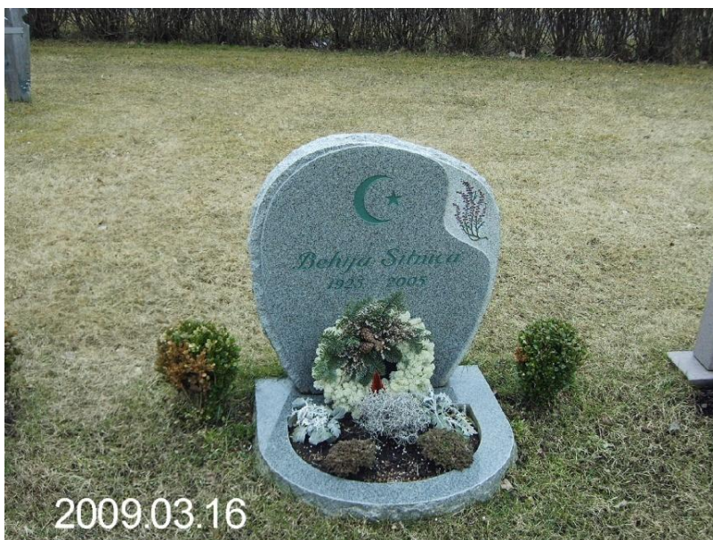
Grav på Nybros muslimska del utsmyckad med krans, planterade buxbombsbuskar och blommor samt en enkel bild på gravstensens ena hörn.

Det som är helt anorlunda mot begravningsplatsen i Malmö är att det i Nybro inte finns någon markering för fotändan på gravarna. Det är endast den grav som är helt nyanlagd som har markeringar på både huvud- och fotändan, men på de resterande gravarna så är det som mest endast ett litet område framför gravstenarna som är markerat med till exempel en enkel stenram i vilken några få planterade blommor rymms. Vissa av gravarna har inte ens något område framför sig som är utmärkt, utan står för sig själva i gräsmattan. Det enda som skiljer de muslimska gravarna från de protestantiska är att på alla gravstenarna så finns den muslimska symbolen med månskärnan och stjärnan.