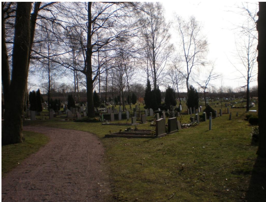
Bild över den äldre delen av den muslimska begravningsplatsen där både de större träden, de stora vintergröna buskarna samt gravarna orientering syns.

Det nya området har några få nyanlagda gravar placerade längs med bokhäcken i ytterkanten av begravningsplatsen, vilket gör att det är ett stort öppet område utan varken vegetation eller gravarplatser mellan dessa gravar och de resterande avdelningarna på begravningsplatsen. Sop- och kompostförvaringarna är dolda av ett omringande grönmålat trästaket. Då detta är de enda byggda elementen på området, och det dessutom inte finns några häckar i samma höjd, märks dessa rätt tydligt trots att man