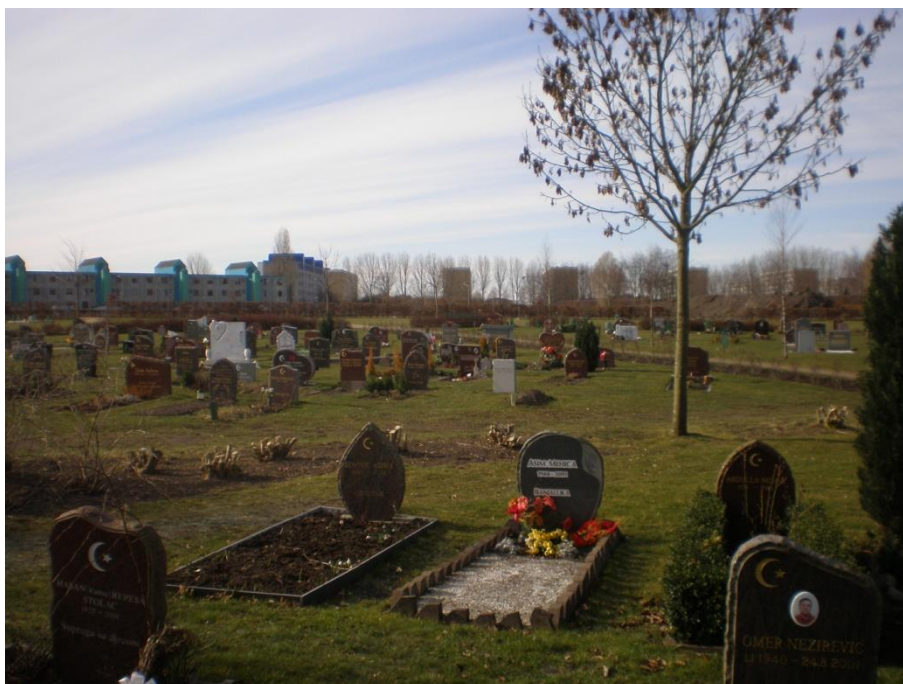
Bild över de nyare delarna av begravningsplatsen där det är glest med häckar och träd som skapar rumslighet.

När man som besökare går in på begravningsplatsen kan man, som ett resultat av frånvaron av en rumsbildande vegetation och den okuperade landskapsbilden, snabbt överblicka hela området. Därför märks det tydligt att gravarna är orienterade mot samma håll, eftersom gravvårdarna har baksidan vänd mot gången på den ena sidan och de på den andra sidan är vända mot gången. Detta är något som sällan förekommer på kristna begravningsplatser, där gravvårdarna för det mesta är orienterade så att man som besökare kan läsa gravvårdarnas inskription från gången.