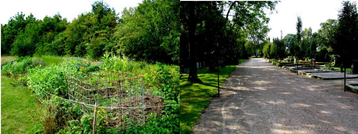
Figur 6.1 Bilderna visar exempel på Lustgårdar utvalda i kommuner representerade av plankontor. Till vänster syns en koloniträdgård och till höger en kyrkogård.

Båda dessa kommuner använde sig av kartor med relativt hög detaljeringsgrad för att markera platserna. Kartorna var i A1-format, i de flesta övriga kommuner har vanliga besökskartor använts. Detta medförde att framförallt kransorterna syntes tydligare i dessa kommuners förberedelser. I dessa kommuner valdes varierande platser ut som Lustgården. Exempel är badplatser, minigolfbanor, kyrkogårdar, koloniträdgårdar och parker. Kännedomen om platserna i huvudtätorterna var större än om platserna utanför huvudtätorterna, och relativt har ett större antal platser i huvudtätorterna också identifierats. Detta trots den höga detaljeringsgraden på grundmaterialet.