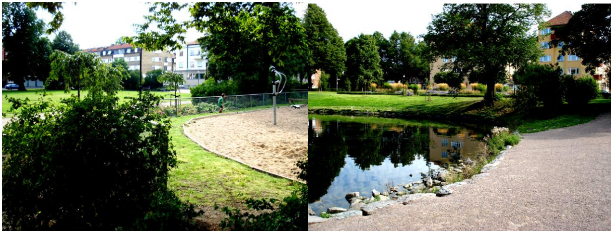
Figur 6.2 Bilderna visar exempel på Lustgårdar som valts ut i kommuner representerade av parkförvaltningar. Tydligt är att platserna är stora samt har olika funktioner. Till vänster syns en lekplats och en grönyta, till höger en damm och där bakom skymtar ett sittlandskap med prydnadsväxter.

Platser som ofta valdes ut som lustgårdar i dessa kommuner är parker som finns med i parkförvaltningens skötselplan. Innehållet är i huvudsak grönytor med planteringar, lekplatser och dammar. På frågan om platserna används var svaret ofta ”det gör de säkert”, varför svaren upplevdes som mer hypotetiska. Representanterna tycktes anta att om parken är fin och ligger nära ett bostadsområde används den. Personen som arbetar som driftsledare på en av parkförvaltningarna tycktes säkrare på hur platserna faktiskt används. Alla platser som valts ut av dessa två kommuner är direkt kopplade till tätorter, såväl kommunernas huvudtätort som mindre tätorter. Större osäkerhet om hur platserna i de mindre tätorterna används råder. Vidare är platserna ofta stora, med olika funktioner. Vid besök på några av platserna uppfattas de mer som områden än som platser, och upplevs innehålla fler än en karaktär.