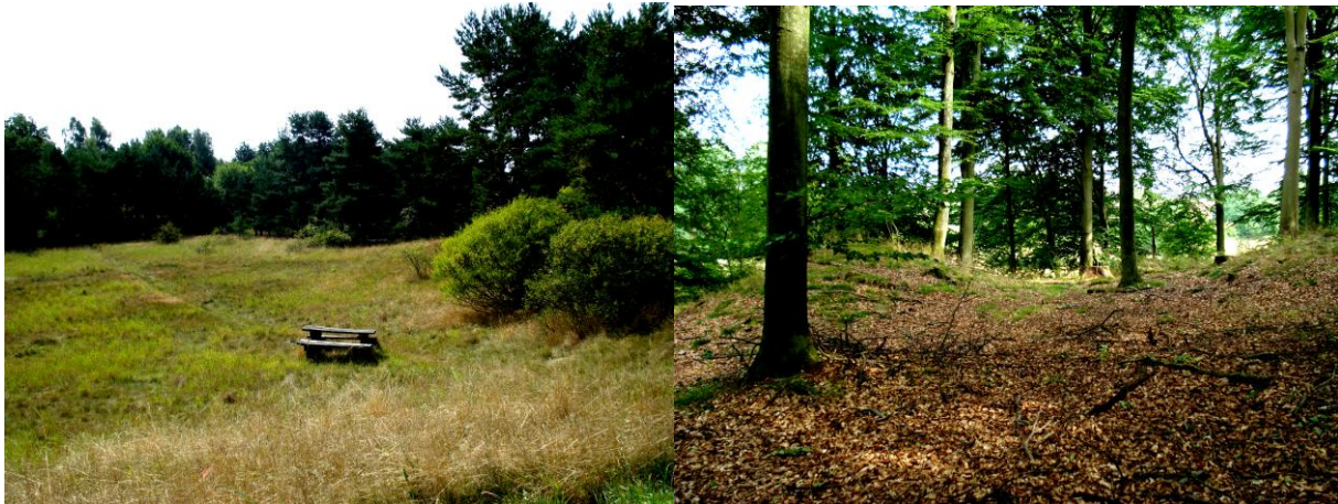
Figur 6.3 Bilderna visar exempel på Lustgårdar som valts ut i kommun representerad av miljökontor. Till vänster syns ett ängslandskap med inslag av skog, till höger en bokskog.

Platser som ofta valdes ut som lustgårdar i denna kommun var i huvudsak naturområden som låg utanför tätort. Dalgångar, ädellövskogar och ängar är några exempel. Vid vidare diskussion framkom att dessa platser valts ut i första hand för att de var ”vackra” och att de innehöll en mångfald av framförallt växter. Denna uppfattning verkade vara representanternas egen. På frågan om vad dessa platser används till av människor som besöker dem var svaret något oklart. Vissa utav de valda platserna verkade inte vara så tillgängliga rent fysiskt, utan man var tvungen att känna till den aktuella platsen för att kunna besöka den. Platserna användes mest för promenader och naturupplevelse av besökarna, på ett och annat ställe fanns möjlighet att slå sig ner för att ha picnic.