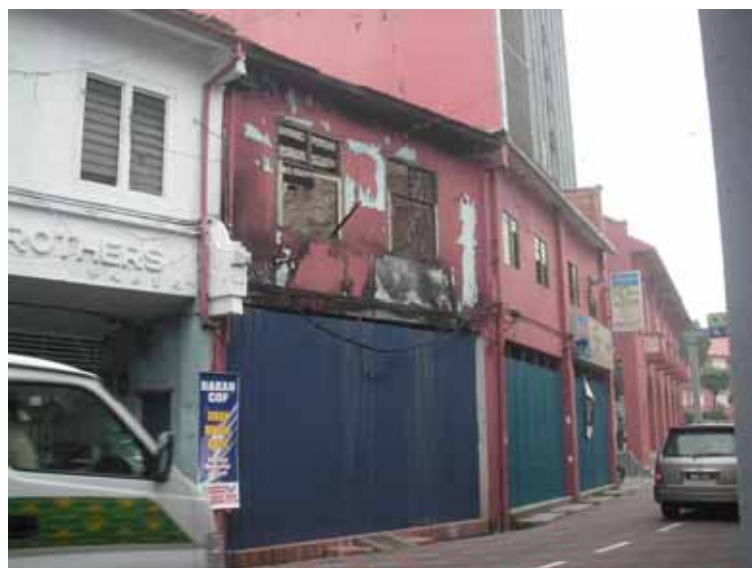
Gf 1.2 : Rumah Kedai Yang Terbakar Yang Dibiarkan Begitu Sahaja (Jalan Laksamana), 2006