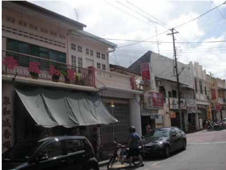
Gf 1.8 : Skala Yang Berbeza Pada Deretan Rumah Kedai di Jalan Tokong, 2007

Penggunaan pelindung bayang (shading device) (rujuk gf 1.10) dalam pelbagai bentuk juga telah menyebabkan fasad bangunan ditutup sepenuhnya. Perletakkan papan iklan yang tidak terkawal juga menutup fasad hadapan rumah kedai (rujuk gf 1.9). Ketidakteraturan saiz dan ukuran papan iklan ini telah menyembunyikan keindahan senibina bangunan rumah kedai dan seterusnya mencacatkan pemandangan.