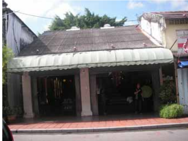
Gf 1.4 : Dua Rumah Kedai Yang Digabungkan Di Jalan Hang Jebat,2007

Dengan peredaran masa pula peranan rumah kedai turut berubah. Pemilik bangunan tidak lagi tinggal di rumah kedai mereka tetapi menyewakannya. Penyewa menjalankan aktiviti perniagaan di tingkat bawah manakala tingkat atas pula disewakan kepada orang lain. Selalunya ruang bahagian atas disekat untuk dijadikan bilik-bilik yang lebih kecil dan bilik-bilik ini disewakan pula kepada sesiapa yang berminat. Ini menyebabkan keadaan ruang dalaman menjadi sesak dan tahap kebersihan menjadi masalah utama.