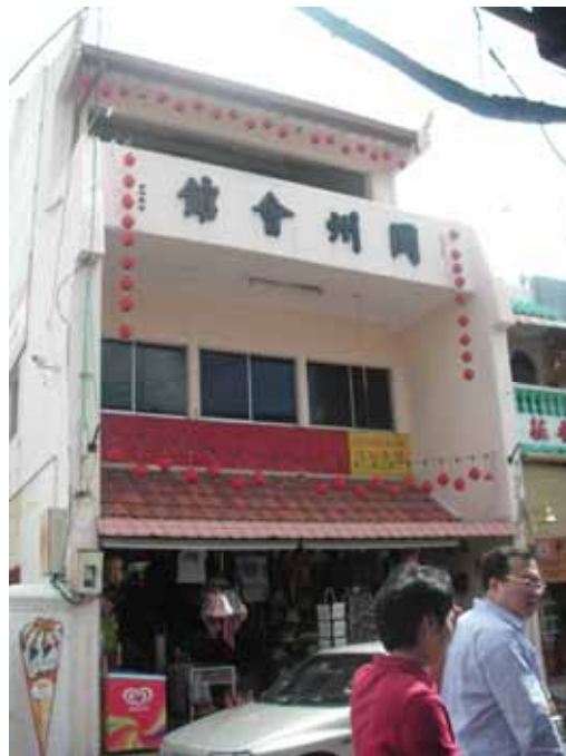
Gf1.12 : Penambahan Tingkat Pada Salah Sebuah Bangunan Di Jalan Tokong, 2007

Fasad bangunan ada kalanya ditambah ketinggian ke tiga tingkat dan ini menyebabkan skala asal telah berubah dan ketinggian bangunan tidak lagi seragam (rujuk 1.12). Ada kalanya fasad hadapan dikekalkan dan tidak mengalami perubahan tetapi penambahan dilakukan pada bahagian belakang bangunan. Ketinggian bahagian belakang bangunan ditambah sehingga ke tiga tingkat (rujuk gf 1.13). Perubahan ini tidak ketara sekiranya kita melihat dari hadapan bangunan tetapi realitinya ruang dalaman telah diubahsuai secara menyeluruh dan ini telah mengubah karektor senibina bangunan tersebut. Secara tidak langsung juga dengan penambahan dan pengubahsuaian ini bahan binaan baru telah diperkenalkan.