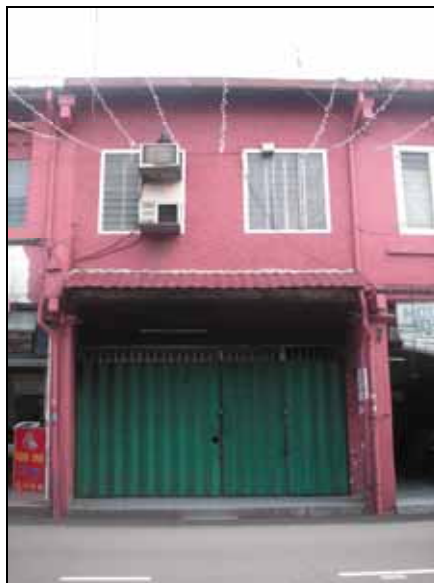
Gf 1.11 : Unit Pendingin Udara Di Tingkap Hadapan Rumah Kedai (Jalan Laksamana), 2006

Meletakkan unit pendingin udara pada fasad hadapan tanpa memikirkan tentang gayarupa fasad juga banyak dapat dilihat pada rumah - rumah kedai di Melaka (rujuk gf 1.11). Kesan daripada perletakkan unit pendingin udara tanpa kawalan ini telah mencacatkan fasad bangunan tersebut.