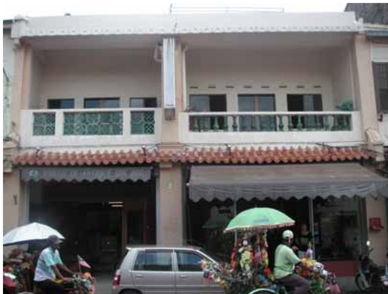
Gf 1.6 : Perubahan Pada Fasad Hadapan Rumah Kedai di Jalan Hang Jebat, 2007