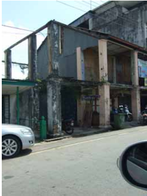
Gf 1.1 : Bangunan Usang Yang Terbiar (Jalan Bendahara), 2007

mereka setelah mendapati bangunan tersebut tidak selamat lagi untuk diduduki. Keadaan sebegini memburukkan lagi imej deretan bangunan-bangunan tersebut.