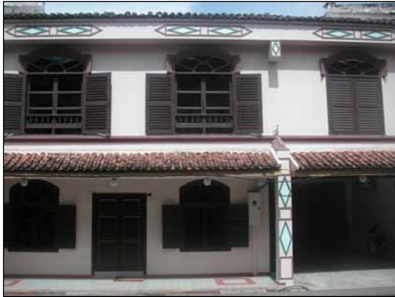
Gf 1.5 : Perubahan Pada Fasad Hadapan Rumah Kedai di Jalan Hang Jebat, 2007

rumah kedai lama ini lebih dipengaruhi oleh 'trend' semasa terutamanya apabila ia melibatkan perubahan fasad hadapan sahaja. (rujuk gf 1.5, gf 1.6 dan gf 1.7).