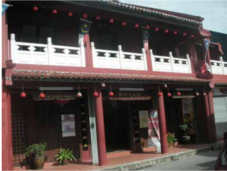
Gf 1.7 : Perubahan Pada Fasad Hadapan Rumah Kedai di Jalan Hang Jebat, 2007

Pengubahsuaian atau pembinaan bangunan baru pula tidak langsung menghiraukan tentang skala, konteks, dan karektor bangunan sekeliling (rujuk gf 1.8). Kesenambungan rekabentuk di antara unit baru dan lama tidak dihiraukan. Ini menjadikan bangunan baru tersebut seolah-olah berdiri dengan sendirinya dan kelihatan janggal di persekitaran sendiri. Ketiadaan integrasi pembangunan terutamanya rekabentuk di antara bangunan moden dan lama ini mencacatkan identiti kawasan yang bersejarah ini. Akibatnya, keunikkan bangunan-bangunan rumah kedai lama di bandar Melaka mulai hilang dan bandar Melaka telah dipaksa untuk menerima unsur-unsur rekaan baru yang kurang sesuai dan tidak harmoni.