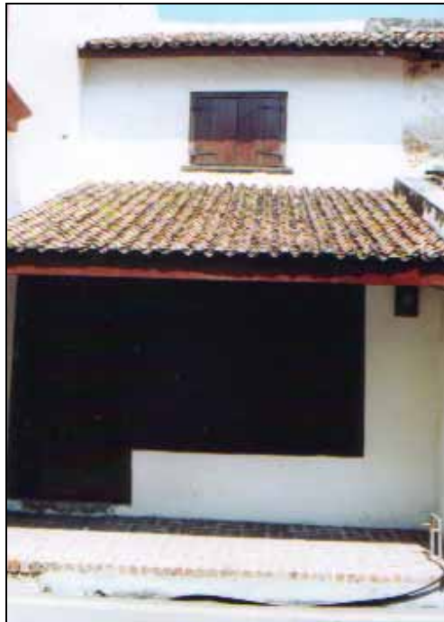
Gf 1.14 : No 8, Jalan Tun Tan Cheng Lock, 2004

Walau bagaimanapun, terdapat juga usaha orang-orang perseorangan dan organisasi-organisasi tertentu yang bergiat dalam mempertahankan rumah-rumah kedai ini. Di antara bangunan yang telah direnovasi dan mengekalkan susunatur ruang dalamnya adalah bangunan No 8, Jalan Tun Tan Cheng Lock/Heeren Street (rujuk gf1.14). Bangunan ini adalah milik Kuil Cheng Hoon Teng dan kini menjadi model bagi kerja - kerja konservasi di Melaka. Bangunan ini telah dibina pada awal tahun 1700-an dan dibaik pulih dengan kos RM73,000 menerusi bantuan dana Kedutaan Amerika. Ia adalah usahasama di antara Kedutaan Amerika Syarikat di Malaysia dan Badan Warisan Malaysia di bawah Projek 'Ambassador's Fund For Cultural Preservation'.