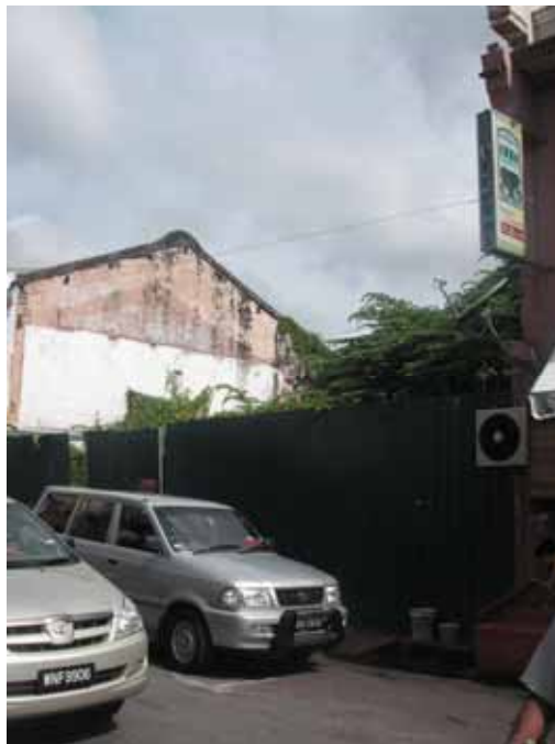
Gf 1.3 : Tapak Rumah Kedai Di Jalan Hang Jebat Yang Dirobuhkan Tidak Dibangunkan Sehingga Kini, 2007

Pemilik bangunan berkenaan seterusnya didakwa mengikut Akta Perancang Bandar dan Desa 1976 (Pindaan 2001) yang telah dikuat kuasakan mulai bulan Februari 2002 dan Enekmen Pemuliharaan dan Pemugaran Warisan Budaya, 1988 (Berita Harian, 2002). Menurut Akta Perancang Bandar dan Desa 1976 (Pindaan 2001), denda yang dikenakan adalah RM 500,000 atau dua tahun penjara atau kedua-duanya sekali manakala menurut Enekmen Pemuliharaan dan Pemugaran Warisan Budaya, 1988, pemilik bangunan akan didenda RM10,000 atau penjara lima tahun atau kedua-duanya sekali. Denda akan tetap dibayar oleh pemilik premis tetapi negara kehilangan bangunan yang menjadi warisan buat selama-lamanya. Tindakan merobohkan bangunan-bangunan lama yang mempunyai nilai sejarah dan senibina ini telah menghakis imej yang ada pada bandar Melaka. Lebih mendukacitakan apabila tapak bangunan tersebut dibiarkan kosong sehingga kini tanpa sebarang tindakan untuk memajukannya (rujuk gf 1.3).