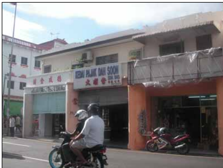
Gf 1.9 : Penggunaan Papan Tanda Yang Tidak Dikawal Saiznya, Menutupi Fasad Bangunan, 2005

Penggunaan pelindung bayang (shading device) (rujuk gf 1.10) dalam pelbagai bentuk juga telah menyebabkan fasad bangunan ditutup sepenuhnya. Perletakkan papan iklan yang tidak terkawal juga menutup fasad hadapan rumah kedai (rujuk gf 1.9). Ketidakteraturan saiz dan ukuran papan iklan ini telah menyembunyikan keindahan senibina bangunan rumah kedai dan seterusnya mencacatkan pemandangan.