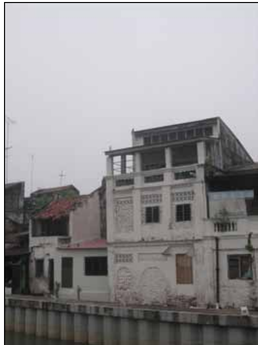
Gf 1.13 : Pandangan Belakang Salah Sebuah Rumah Kedai Di Lorong Hang Jebat, 2006

Elizabeth, V (2002) mengatakan bahawa 'trend' mengekalkan fasad ini dinamakan 'facadism' dan mula muncul di tahun 1980an dan merupakan 'trend' experimentasi oleh para arkitek. Fasad bangunan dikekalkan tetapi keseluruhan ruang dalaman telah diperbaharui. Bahayanya 'trend' ini adalah kerana tidak banyak projek sebegini yang benar-benar berjaya (Cheah, U. H, 2000).