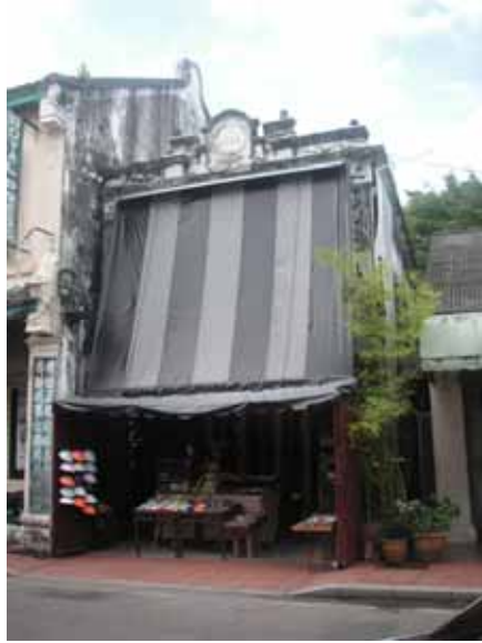
Gf 1.10 : Penggunaan Pelindung Bayang Yang Menutupi Keseluruhan Fasad Bangunan, 2007

Meletakkan unit pendingin udara pada fasad hadapan tanpa memikirkan tentang gayarupa fasad juga banyak dapat dilihat pada rumah - rumah kedai di Melaka (rujuk gf 1.11). Kesan daripada perletakkan unit pendingin udara tanpa kawalan ini telah mencacatkan fasad bangunan tersebut.