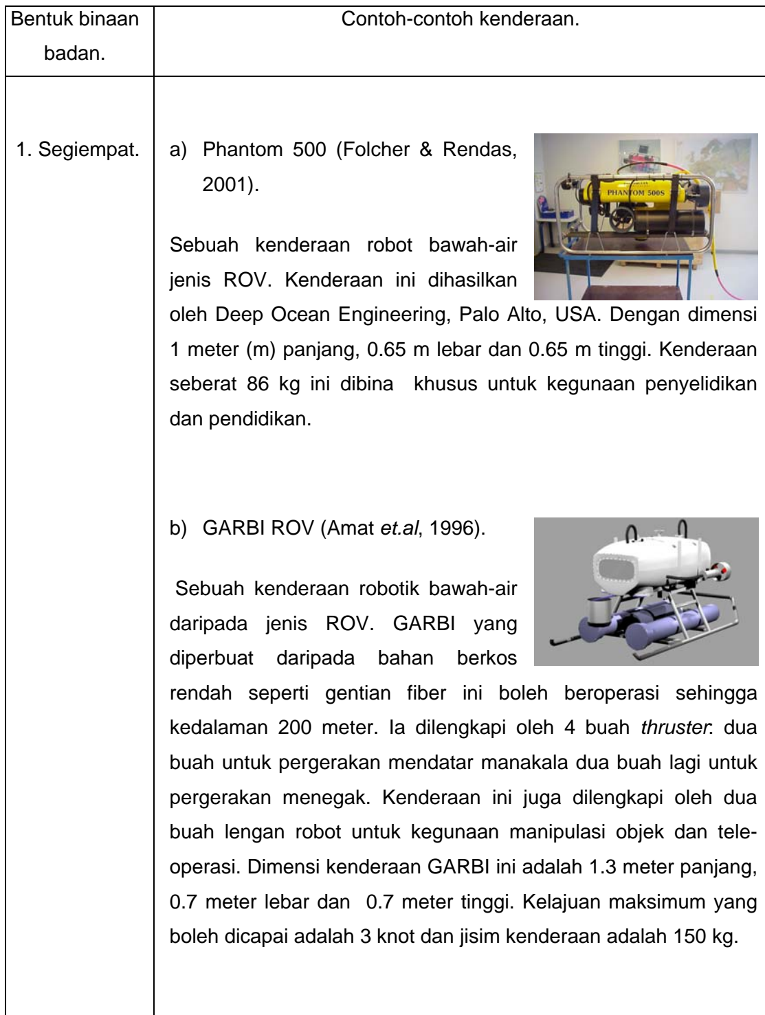
Jadual 2.2: Contoh-Contoh Bentuk Binaan Badan Kendaraan Robotik Bawah-Air.