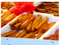
„Schillerlocke“ aus geräuchertem Dornhai