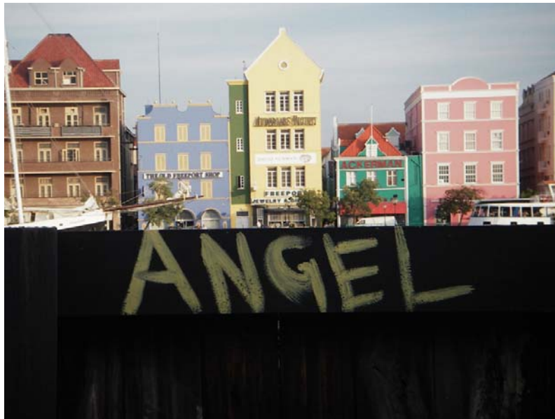
Abb. 2: Zweifelhafte neue Kunst an der Kaimauer vor den Fassaden der historischen Altstadt Curacaos.

Auf dem Transit nach Christobal konnten dank guter Maschinenleistung trotz eines engen Zeitplanes fünf Flachwasserstationen (1000 m) mit CTD/Rosette im Abstand von 120 m entlang des Südrandes des Columbia Basins durchgeführt werden. Ziel war es, neben der Nährstoffverteilung auch die Verteilung der Spurengase Methan und N_2O (letztere im Labor an Land nach der Fahrt) zu ermitteln. Abgerundet wurde das Programm mit einer kontinuierlichen Aufzeichnung der Methankonzentration des Oberflächenwassers und der marinen Atmosphäre. Es zeigt sich eine CH_4 -Übersättigung von 10-20 Prozent, die nach den Messungen der Proben aus dem Kranzwasserschöpfer durch ein Maximum der Methankonzentration in Wassertiefen zwischen 30 und 100 m verursacht ist.