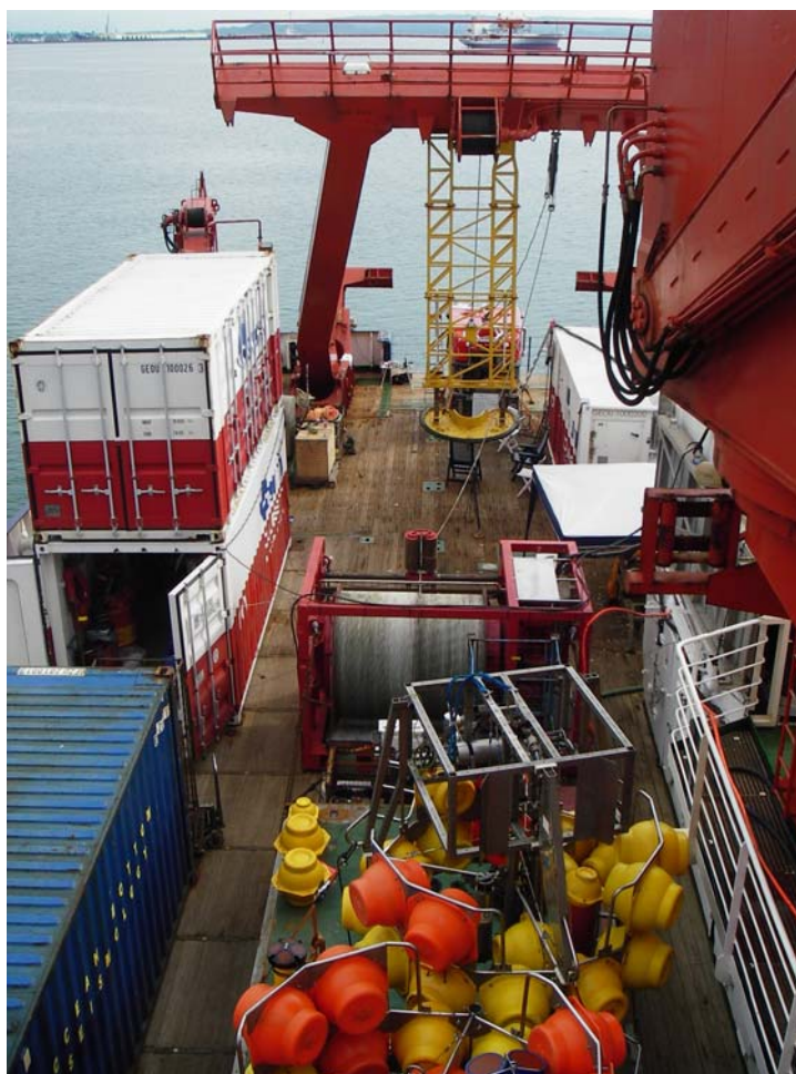
Abb. 1: Blick auf das „gut genutzte“ Arbeitsdeck von FS METEOR zu Beginn der Expedition M66/2a

Die Reise begann mit einer zügigen und erfolgreichen Verladung der wissenschaftlichen Ausrüstung im Hafen von Curacao. Ein kleiner Voraustrupp hatte sich, unterstützt von einer Hafencrew, am Morgen des 20. September zur Entladung von 3 Containern mit wissenschaftlichem Equipment eingefunden, darunter ein 40-Fusser. Zudem wurde der Isotopencontainer und ein Geophysikcontainer an Deck gebracht. Darauf folgten der Kontrollcontainer und der Werkstoffcontainer des Bremer QUEST-Systems. Die Winde wurde entladen und montiert, der Tiefseeroboter QUEST aus seinem Container gehievt und der Container in die zweite Lage gestellt. Nachdem am Abend des 20. September weitere Mitglieder der wissenschaftlichen Besatzung eintrafen, waren vierundzwanzig Stunden später am Abend vor dem Auslaufen die Labore weitestgehend aufgebaut, die Großgeräte an ihrem Platz und alles seefest gemacht. Ein Blick auf das Arbeitsdeck räumt nun auch die letzten Zweifel aus, dass die Einschätzung es würde voll werden ebenso begründet war wie die Entscheidung einen Container in die zweite Lage zu stellen (Abb.1).