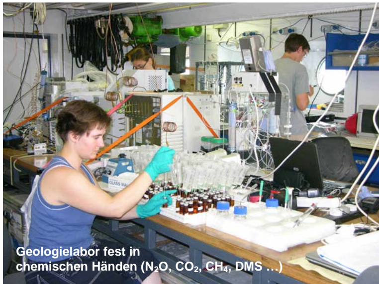
Geologielabor fest in chemischen Händen (N 2 O, CO 2 , CH 4 , DMS ...)

und Prozesse (Stickstoff-Fixierung, Ozean-Atmosphäre-Gasaustausch) eine zentrale Rolle. Auftriebsgebiete in Regionen mit starkem Staubeintrag stellen gewissermaßen biogeochemische Reaktoren dar, die gleichzeitig durch vertikale (Makro- und Mikro-) Nährstoffeinträge aus der Atmosphäre und bis zu 200 m Wassertiefe angetrieben werden. Zu beobachtende Austauschflüsse klimarelevanter Gase zwischen Ozean und Atmosphäre liegen aufgrund der hohen Sättigungsanomalien und des starken Windantriebs deutlich über den im offenen Ozean vorgefundenen Verhältnissen.