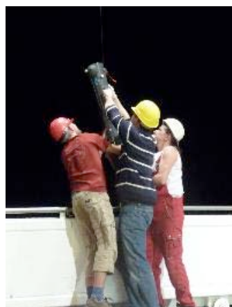
Die Spurenmetaller beim Einholen eines GOFLO Schöpfers.

Das stetig wärmer werdende Wetter und deutliche Fortschritte beim Installieren des Deckspools ermöglichten uns am Abend eine angenehme Abkühlung and