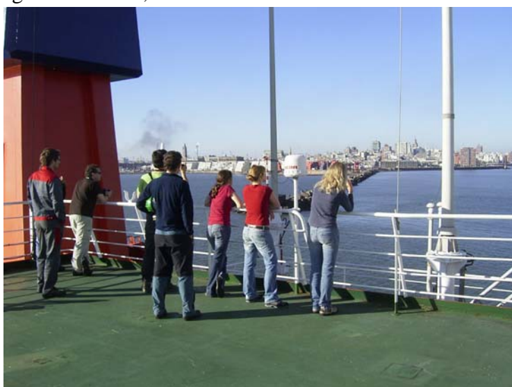
Abb. 1: Auslaufen aus Montevideo

und wir bereits am 19.05 um 15:00h bei herrlichem Sonnenschein den Hafen von Montevideo verlassen konnten (Fig. 1). Für das Auspacken der Container und die Hilfe beim Aufbauen der Geräte bedanken wir uns bei der Besatzung der Meteor recht herzlich. Insgesamt konnte durch den vereinten Einsatz von Leitstelle, Schiff und Reederei der Verlust an Arbeitstagen auf 2 minimiert werden.