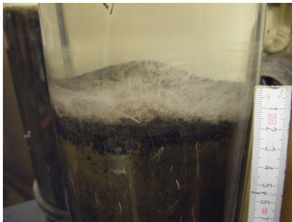
Abb. 2: Sedimentoberfläche innerhalb eines Multicorer Liners, die dicht mit Schwefel-Bakterien besiedelt ist. Diese Bakterien sind in den nahezu anoxischen Flachwasserbereichen am oberen Rand der Sauerstoffminimumzone vor Peru und Chile weitverbreitet und haben vermutlich einen enormen Einfluss auf die Nährstoffdynamik dieser Gewässer.

Bislang lag der Schwerpunkt der Arbeiten auf dem Schelf und dem oberen Kontinentalhang. Der Meeresboden bis zu einer Wassertiefe von 300 m ist unglaublich dicht von dicken Matten, die von schwefeloxidierenden filamentösen Bakterien ( Thioploca und Beggiatoa ) gebildet werden, besiedelt, Abbildung 2. Diese Bakterien gewinnen ihre Energie aus der Oxidation von Schwefelwasserstoff, der bei der Zersetzung von organischer Materie entsteht. Neben Sauerstoff können diese Bakterien Nitrat, das sie in hohen Konzentrationen in ihren Vakuolen speichern, zu dieser Oxidation verwenden. Bei diesem Prozess entsteht neben mehreren Zwischenprodukten Stickstoff ( N_2 ) aber auch Ammonium, das als wichtiger Nährstoff wieder in die Wassersäule abgegeben wird und über positive Rückkoppelungsmechanismen die Primärproduktion an der Meeresoberfläche weiterhin "anheizt". Erste Messungen zeigen, dass diese Sedimente ferner sehr hohe Mengen an Phosphat freisetzen, die zu den höchsten Freisetzungsraten, die bisher in marinen Systemen gemessen wurden, gehören.