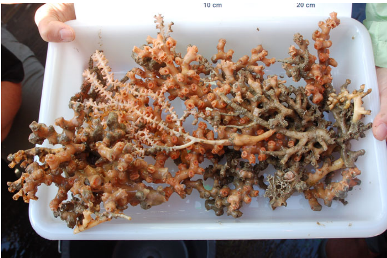
Reiche Ernte mit dem TV-Greifer: Eine lebende Solenosmilia Kolonie und eine lebende Bambus Koralle

CTD hatte die potentiell höffige Tiefe schon etwas eingegrenzt. Überraschenderweise trafen wir dann aber bereits in ca. 1800m Tiefe auf Korallen. Hierbei handelt es sich um parautochtonen Schutt, der stellenweise lebende Äste zeigte. Die Steinkorallenkolonien gehören alle zur Gattung Solenosmilia . Weiter hangaufwärts, bereits im Einfluss des Mittelmeerausstromes, war die Korallenbesiedlung sehr rar, ganz vereinzelt wurden tote Lophelia Äste gesichtet. Generell waren die Canyonhänge durch geringe Sedimentbedeckung gekennzeichnet. Vielfach konnten wir zementierte, plattenartige Partien beobachten. Dem OFOS Einsatz sollte ein Landereinsatz folgen, der über einen längeren Zeitraum sowohl die Bodenströmung, als auch die Temperatur und den Salzgehalt des Bodenwassers registrieren sollte. Auffrischender Wind, zwischen 8 und 9 Bft. erlaubten aber eine Bergung des OFOS nicht mehr, so dass die ganze Nacht vom 2. auf den 3. 6. im Schichtwechsel der OFOS weiter geschleppt werden musste.