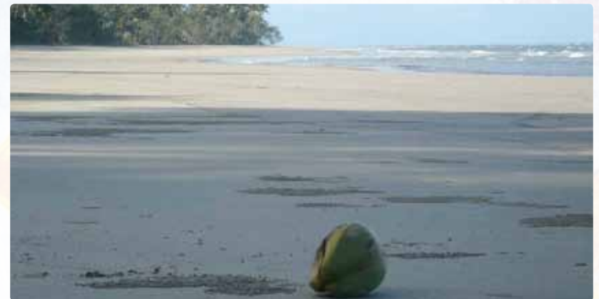
Abbildung 5: Beispiel einer Flachküste in Australien mit einem breiten Sandstrand.

(Aufbau), ihrer Form (Morphologie) und Schnelligkeit (Dynamik), sich an die Umweltbedingungen (zum Beispiel Klima, Meeresspiegel) anzupassen. Da gibt es zum Beispiel die flachen Küsten mit breiten Sandstränden (Abbildung 5). Die Wassertiefe nimmt nur langsam zum offenen Meer zu. An anderen Küsten wiederum endet das Land abrupt an steil aus dem Wasser ragenden Klippen. Strände gleich welcher Gesteinsart gibt es dort keine, da alles, was abbricht direkt im tiefen Wasser verschwindet.