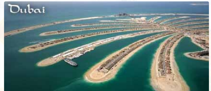
Abbildung 8: Palmeninsel bei Dubai am Arabischen Golf.

Es gibt viele Sandinseln auf denen Palmen wachsen (Abbildung 5). Es gibt aber auch Inseln aus Sand, die aus dem All aussehen wie große Palmen. Diese sind keine Kunstwerke der Natur, sondern jene reicher Wüstenscheichs der Vereinigten Arabischen Emirate. Sie haben die Küstenlinie durch Sandaufspülungen aus dem Meer um ein Vielfaches verlängert, um Urlaubern noch mehr Strand zu bieten (Abbildung 8). Mit dem Computerprogramm Google Earth könnt ihr diese Inseln besuchen. Gebt einfach das Wort „Palmeninsel“ ein und schon fliegt ihr hin.