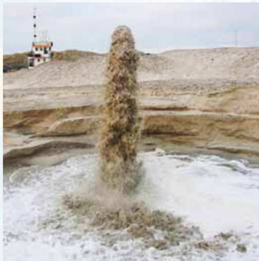
Abbildung 7: Sandaufspülung. Im Hintergrund pumpt der Bagger den Sand, den er vom Meeresboden aufgenommen hat auf den Strand.

Bevor gebaggert wird, gilt es zu erkunden, wo geeigneter Sand liegt. Dabei muss die Korngröße stimmen, denn ist der Sand zu fein, kann er zu leicht von Wind und Wellen fortbewegt werden. Jeder Meter, den das Baggerschiff zurücklegen muss, kostet Geld, so wird nach Sandlagerstätten gesucht, die nahe an der Küste liegen, aber deren Abbau der Küste nicht schadet. Strand-sand wird damit zu einer kostbaren Ware.