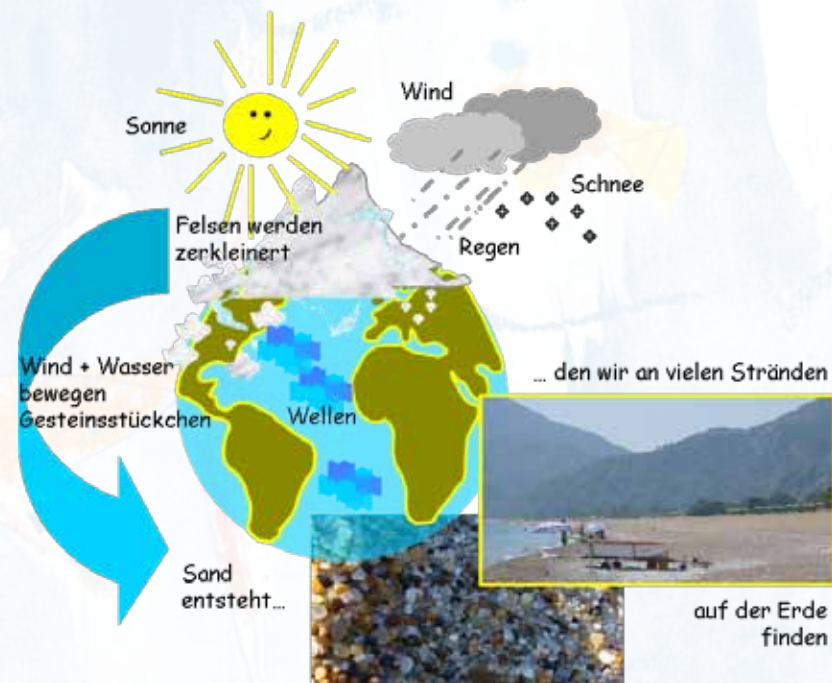
Abbildung 2: Wie aus Felsen Sandkörner werden.

Jedes Sandkörnchen ist ein Bruchstück von dem großen Erdkörper, auf dem wir alle leben. Unendlich viele Sandkörner entstehen, wenn Gestein zum Beispiel der großen Gebirge oder der Felsen am Meer verwittert, das heißt abgetragen (erodiert) wird. Unter dem Einfluss von Wetter, Wind und Wasser zerfällt die Gesteinsoberfläche im Laufe der Zeit in kleine Gesteinsbruchstücke (Abbildung 2). Diesen steht dann oft eine lange Reise bevor. Zunächst sind sie kantig. Auch haben sie natürlich keine Beine. Sie lassen sich vom Wind, Wasser und Eis fortbewegen. Dabei hilft die Schwerkraft, die uns nicht von der Erde fallen lässt, mit. Sie können rollend, hüpfend, springend oder schwimmend bewegt werden, je nachdem wie groß sie sind und welche Kräfte für ihre Fortbewegung sorgen. Während ihrer Reise über Land, durch Fluss und Meer müssen die Gesteinstücke viele Hindernisse überwinden. Dabei zerbrechen viele in kleinere Teilchen. Prallen sie aneinander, können kleine Ecken von ihnen abbrechen. So werden sie immer runder und kleiner bis sie irgendwann Sandkörner werden. Alle zusammen werden als Sand bezeichnet. Seiner Entstehungsgeschichte verdankt der Sand, dass man ihn zur Gesteinsgruppe der Sedimente zählt.