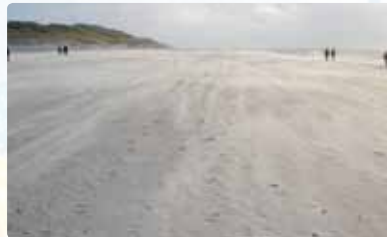
Abbildung 4: Breiter Sandstrand an der Dänischen Nordsee - Sandkörnchen werden vom Wind über den Strand bewegt.