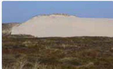
Abbildung 3: Riesige Wanderdüne auf der Nordseeinsel Sylt bei der Ortschaft List.

Sand gibt es eigentlich überall auf der Erde, an Land, in Flüssen, Seen und im Meer. Viel Sand gibt es natürlich in den Wüsten, wo Sand zu riesigen Sandbergen, den Dünen, aufgeweht ist. Große Dünen und unendlich große Mengen Sand gibt es aber auch an vielen Küsten, also dort wo Land und Meer zusammentreffen. Die bis zu 35 Meter hohen Wanderdünen im Norden der Nordseeinsel Sylt sind die größten ihrer Art in Deutschland (Abbildung 3). Dänemarks Westküste ist bekannt für seine schönen breiten Sandstrände (Abbildung 4).