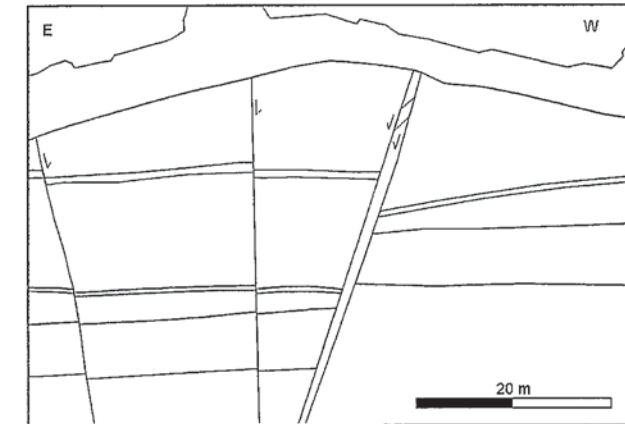
Fig. 2.- Interpretación geológica del escarpe del Tajo de San Pedro. Rojo: paleosuelo, verde: tramo arenoso-limoso, amarillo: tramo de conglomerados.