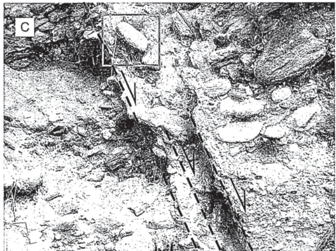
Fig. 3.- A) Cantos reorientados en una zona de falla de espesor decimétrico en la Formación Alhambra. B) Zona de falla en la que se observa un canto roto por una diaclasa de extensión. C) Canto roto y desplazado en una zona de falla.