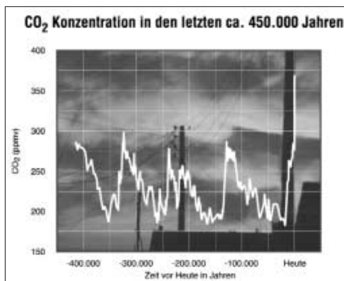
Abb. 1: CO 2 -Konzentration in den letzten ca. 450.000 Jahren

Messungen belegen zweifelsfrei, dass sich die Konzentration von CO 2 in der Atmosphäre seit Beginn der industriellen Revolution rasant erhöht hat (Abb.1). Lag der CO 2 -Gehalt um 1800 noch bei ca. 280 ppm, so liegt er heute schon bei ca. 370 ppm. Dass der Mensch für diesen Anstieg verantwortlich ist, ist unstrittig. Ein Blick in die Vergangenheit zeigt, dass der CO 2 -Gehalt heute schon so hoch ist wie seit ca. 400.000 Jahren nicht mehr. Dabei hat man die Schwankungen in der chemischen Zusammensetzung der Erdatmosphäre aus Eisbohrkernen rekonstruiert, indem die im Eis eingeschlossenen Luftbläschen analysiert wurden. Der CO 2 -Ge-