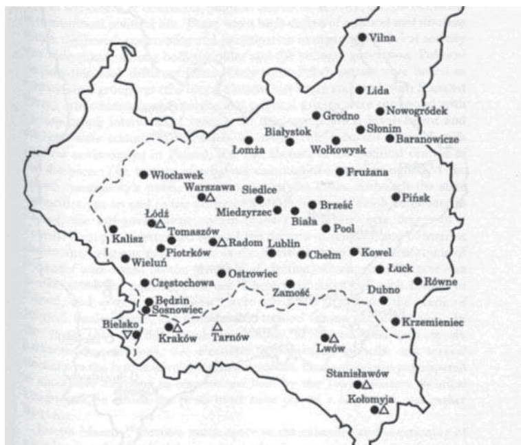
Mapa 1. Ośrodki prasy żydowskiej w Polsce 1918–1939

Prasa żydowska w językach: ● jidysz i hebrajskim; ▲ polskim; ▼ niemieckim