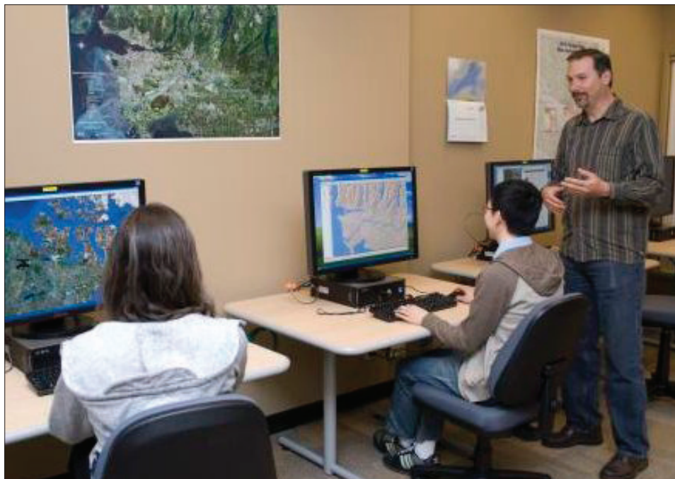
Figura 2. El bibliotecario de la University of British Columbia asesora sobre cómo integrar datos geográficos en proyectos de investigación. http://guides.library.ubc.ca/gis