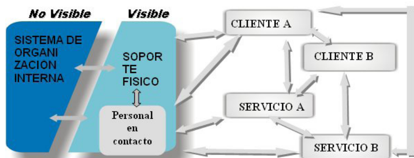
Figura4. Elementos de un sistema de servucción (Gazzera, 2005)

Según el mismo autor, el sistema de servucción debe incluir dos nuevos elementos: los clientes internos, que prestan sus servicios en la unidad de información, y los clientes externos, que son los usuarios de la misma. (Eigle y Langeard, 1998, p. 14). (Ver figura 4).